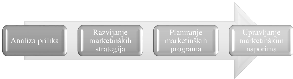
Slika 2: Marketinški proces

te određivanje njihovih cijena promocije i distribucije kako bi se obavila razmjena koja zadovoljava ciljeve pojedinaca i organizacija“ (Paliaga, 2004, 8). Kotler, (1972, u Križman Pavlović, Živolić, 2008, 101), smatra kako je marketing moguće tipizirati s aspekta nositelja aktivnosti, proizvoda ili ciljnog tržišta. Marketinški proces sastoji se od slijedećih elemenata, prikazanih na slici koja slijedi: