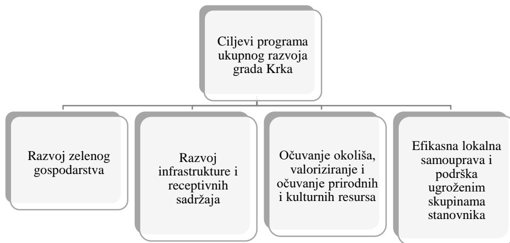
Slika 5: Ciljevi Programa ukupnog razvoja Grada Krka

Ova strategija temelji se na smjernicama razvoja turizma, održivosti i ulaganja u okoliš. U skladu s postavljenim strateškim smjernicama, Grad Krk se pozicionira kao razvijena urbana sredina, u skladu s potrebama turista ali i svog stanovništva, te se temelji na principima održivosti, osobito ekološke. Radi se o strateško-plansko-razvojnom dokumentu koji služi kao sredstvo za učinkovito i uspješno upravljanje razvojem Grada Krka. Na slici koja slijedi, prikazani su strateški ciljevi Programa ukupnog razvoja Grada Krka.