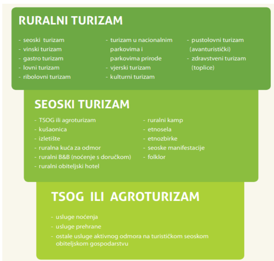
Slika 1. Shematski prikaz međuodnosa ruralnog turizma, seoskog turizma i turizma na turističkom seoskom obiteljskom gospodarstvu (TSOG)