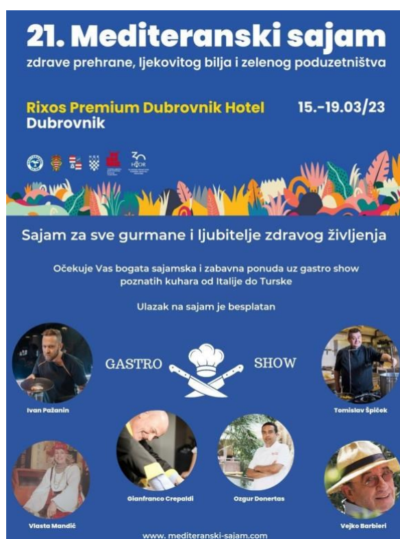
Slika 2. 21.mediteranski sajam

Hoteli također kako bi se promovirali organiziraju razne sajmove i uvode razne certifikate kako bi pokazali ponudu zdrave hrane ali i moderne gastronomije kojom će privući širok spektar gostiju. Jedan od takvih sajmove održava se u hotelu Rixos Premium u Dubrovniku. To je Mediteranski sajam zdrave prehrane, ljekovitog bilja i zelenog poduzetništva. Cilj sajma je postizanje veće razine ekološke svijesti, održivi razvoj, promocija zdrave prehrane, ljekovitog bilja i zelenog poduzetništva, a kroz kvalitetu plasman i marketing 24 . Sajam okuplja ljubitelje zdravog življenja i privlači mnoge gurmane obzirom da u gastro showu sudjeluju poznati kuhari, od Italije do Turske. Mediteranski sjamovi održavaju se i u Hotelu Ivan u Amadria Parku.