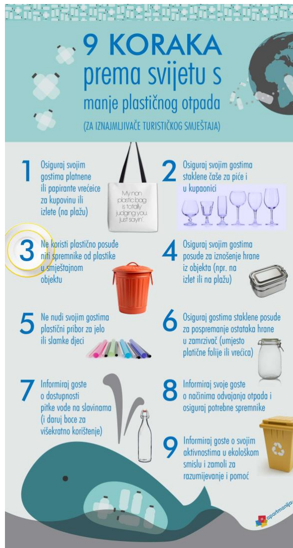
Slika 4. 9 koraka prema svijetu s manje plastičnog otpada.

ugostiteljstvom. Nadalje, uočeno je da u svijetu konstantno rastu površine pod ekološkom poljoprivredom kao i samo tržište ekoloških proizvoda. Međutim, ekološko osviješteni gosti traže ekološki osviještene domaćine. Prema tome, potrebno je obratiti pažnju i na niz drugih čimbenika kod formiranja eko turizma. Jedan od najvećih je smanjenje potrošnje plastike i ostalih štetnih sastojaka za prirodu.