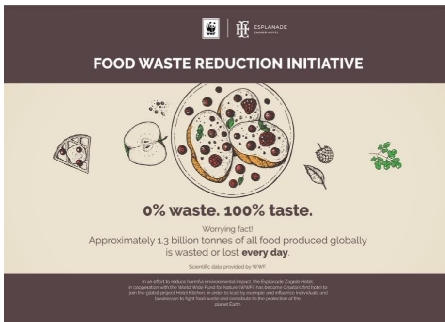
Slika 6. Food Waste reduction initiative