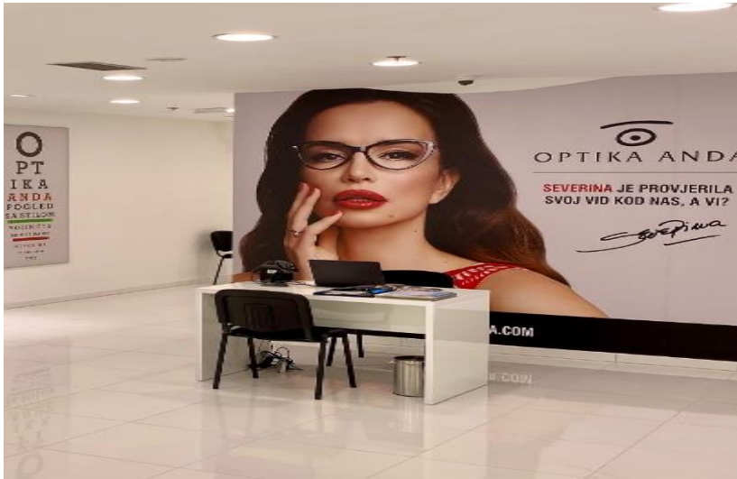
Slika 2 Severina - Optika Anda plakat Izvor: preuzeto sa: City Galleria, 01.02.2023.

Slika 3. prikazuje poznatu pjevačicu Severinu na plakatu Optike Ande kako promovira naočale za vid. Na plakatu piše slogan „Severina je provjerila svoj vid kod nas, a vi?“ te ispod slogana stoji vlastoručni potpis Severine. Ovo je jedan od dobrih primjera oglašavanja u kojem se potrošačima ukazuje primjerom kako poznata osoba promovira proizvod.