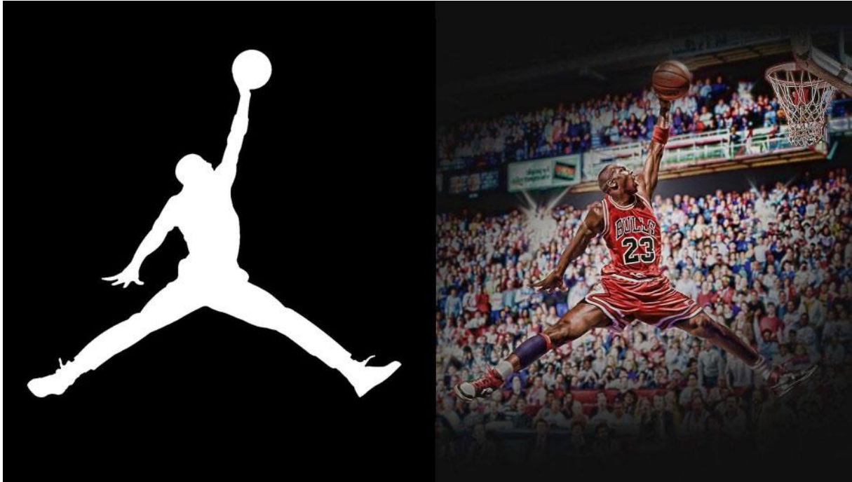
Slika 7 Logo Nike Air Jordan linije napravljen prema skoku Michaela Jordana

Aviation American Gin je brend koji sebe ne shvaća previše ozbiljno. A tko bi bolje utjelovio taj osjećaj od Ryana Reynoldsa, glumca čije su se komedije dobro udomaćile u svemu, od Van Wildera do Deadpoola. Reynolds tipizira sve karakteristike koje brend želi predstaviti: zabavno, opušteno, malo drugačije i dobar provod. Ali iza šale, riječ je o kvalitetnom proizvodu, koji je zaslužio najveću ocjenu ikada (za gin) od časopisa Wine Enthusiast. Poput samog Reynoldsa, koji je možda pomalo šaljivdžija, ali je jedan od glumaca s najvećom zaradom svih vremena. Iako je Aviation American Gin kvalitetan, to nije ono što ovoj podršci slavni daje dodatnu prednost. Činjenica je da Reynolds posjeduje udio u robnoj marki - on je u igri, što pokazuje da je više nego voljan uložiti svoj novac u ono što promovira kada je u pitanju ovaj proizvod. Reynolds je snimio više šaljivih oglasa gdje promovira ovaj gin. Postoji li bolji način za promociju brenda od toga? Čak i ako je, kao što Reynolds ističe u jednom od svojih šaljivih oglasa, Aviation American Gin sada tehnički “u vlasništvu Kanađanina” (UneeQBlog, 2023).