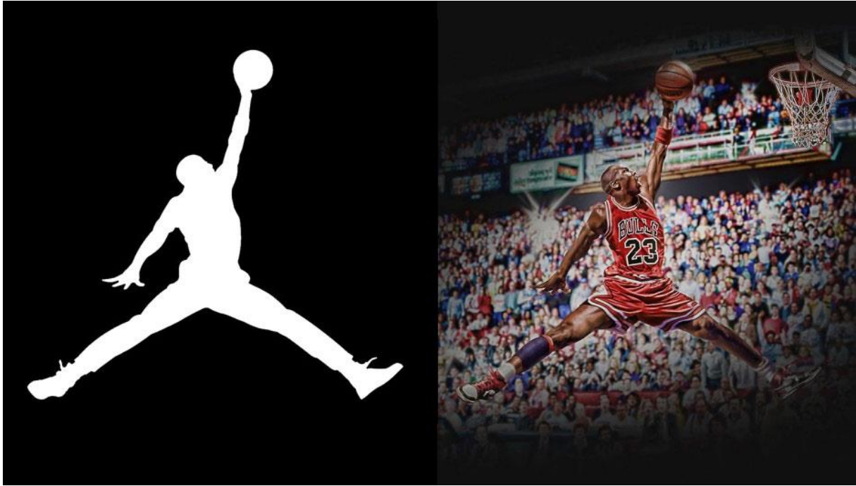
Slika 7 Logo Nike Air Jordan linije napravljen prema skoku Michaela Jordana Izvor: preuzeto sa: BallIsLife.com, 04.03.2023.

Aviation American Gin je brend koji sebe ne shvaća previše ozbiljno. A tko bi bolje utjelovio taj osjećaj od Ryana Reynoldsa, glumca čije su se komedije dobro udomaćile u svemu, od Van Wildera do Deadpoola. Reynolds tipizira sve karakteristike koje brend želi predstaviti: zabavno, opušteno, malo drugačije i dobar provod. Ali iza šale, riječ je o kvalitetnom proizvodu, koji je zaslužio najveću ocjenu ikada (za gin) od časopisa Wine Enthusiast. Poput samog Reynoldsa, koji je možda pomalo šaljivdžija, ali je jedan od glumaca s najvećom zaradom svih vremena. Iako je Aviation American Gin kvalitetan, to nije ono što ovoj podršci slavni daje dodatnu prednost. Činjenica je da Reynolds posjeduje udio u robnoj marki - on je u igri, što pokazuje da je više nego voljan uložiti svoj novac u ono što promovira kada je u pitanju ovaj proizvod. Reynolds je snimio više šaljivih oglasa gdje promovira ovaj gin. Postoji li bolji način za promociju brenda od toga? Čak i ako je, kao što Reynolds ističe u jednom od svojih šaljivih oglasa, Aviation American Gin sada tehnički “u vlasništvu Kanađanina” (UneeQBlog, 2023).