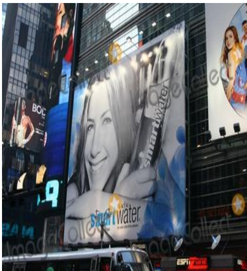
Slika 1 Jennifer Aniston - Smart Water plakat

Poduzeća također postavljaju plakate kako bi privukli pažnju na svoje proizvode. Plakati su ograničeni na minimalno teksta, što često uključuje logo, slogan i naziv marke. Kako bi se istaknuli u masi, nerijetko koriste slavne osobe.