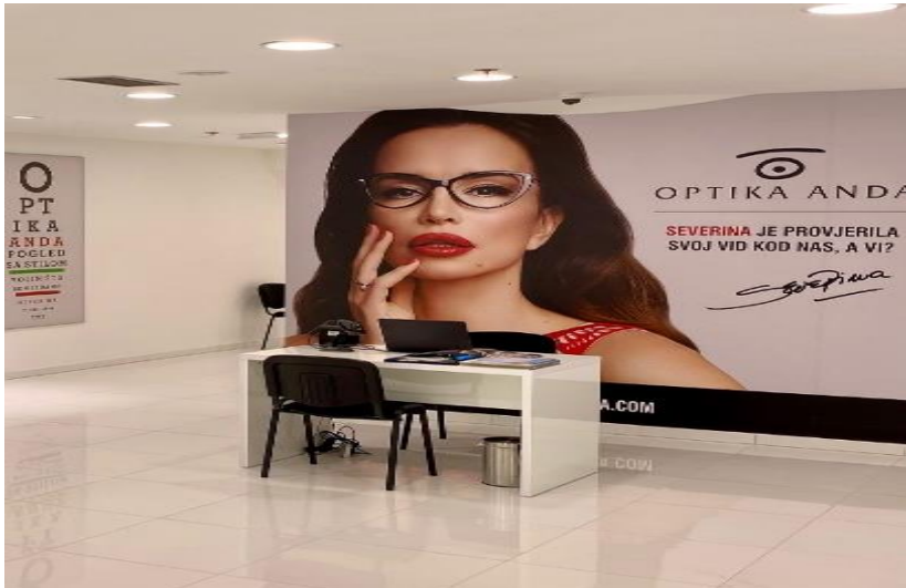
Slika 2 Severina - Optika Anda plakat

Slika 3. prikazuje poznatu pjevačicu Severinu na plakatu Optike Ande kako promovira naočale za vid. Na plakatu piše slogan „Severina je provjerila svoj vid kod nas, a vi?“ te ispod slogana stoji vlastoručni potpis Severine. Ovo je jedan od dobrih primjera oglašavanja u kojem se potrošačima ukazuje primjerom kako poznata osoba promovira proizvod.