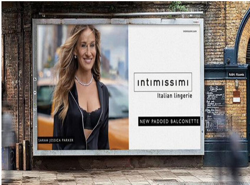
Slika 4 Sarah Jessica Parker - Intimissimi plakat

Slika 5. prikazuje plakat marke donjeg rublja Intimissimi na kojem je poznata glumica Sarah Jessica Parker i nosi grudnjak već spomenute marke. Iz teksta na plakatu „New padded balconette“ saznaje se da je cilj ovog plakata promovirati novi proizvod, u ovom slučaju grudnjak te automatski sugerira da se pogleda na grudnjak koji glumica nosi.