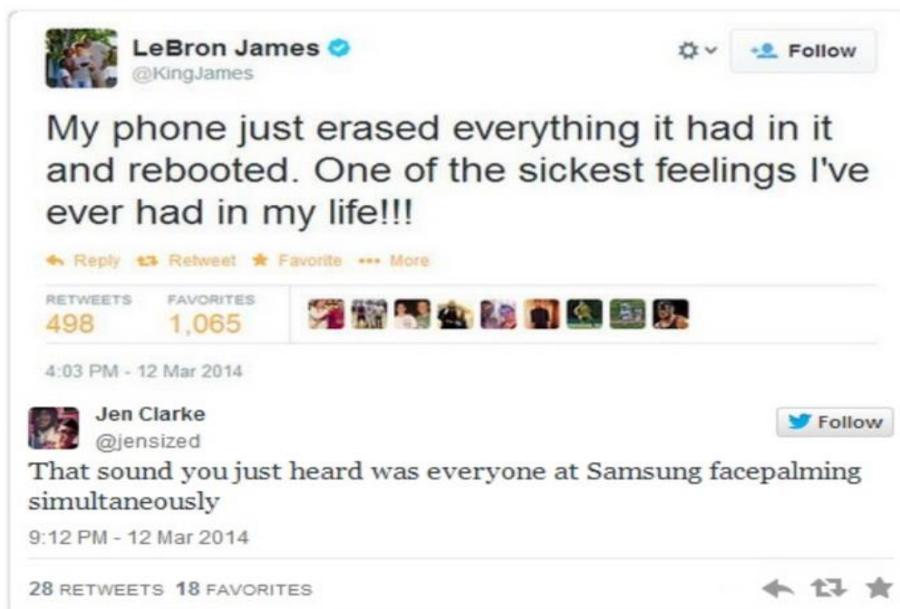
Slika 8 LeBronov tweet

Samsung je bio oduševljen što je osigurao usluge najboljeg košarkaša na svijetu za promociju svog novog Samsung Galaxy Note III. To bi za njih bio način da osvoje tržišni udio od Applea. Nažalost za njih, kada se LeBronov Samsung telefon pokvario, odlučio je tweetati o tome svojih 12 milijuna sljedbenika.