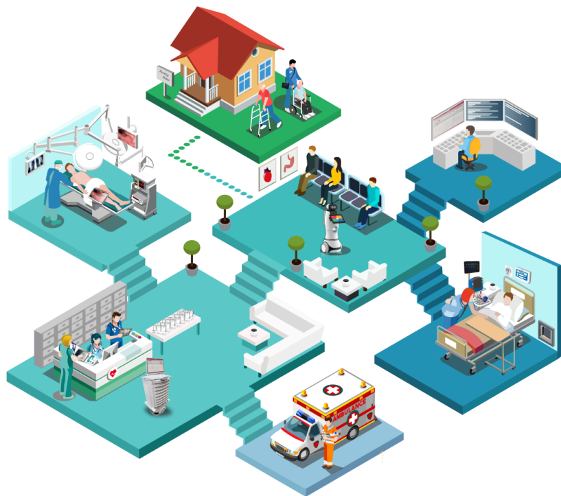
Shema 2: Primjer pametne zdravstvene skrbi

Kada je u pitanju pametna briga za okoliš, gradovi stavljaju naglasak na stvaranje i očuvanje zelenih površina poput parkova i vrtova. Takvi prostori pružaju prostor za rekreaciju te pomažu u apsorpciji ugljičnog dioksida i drugih zagađivača te se time poboljšava kvaliteta zraka.