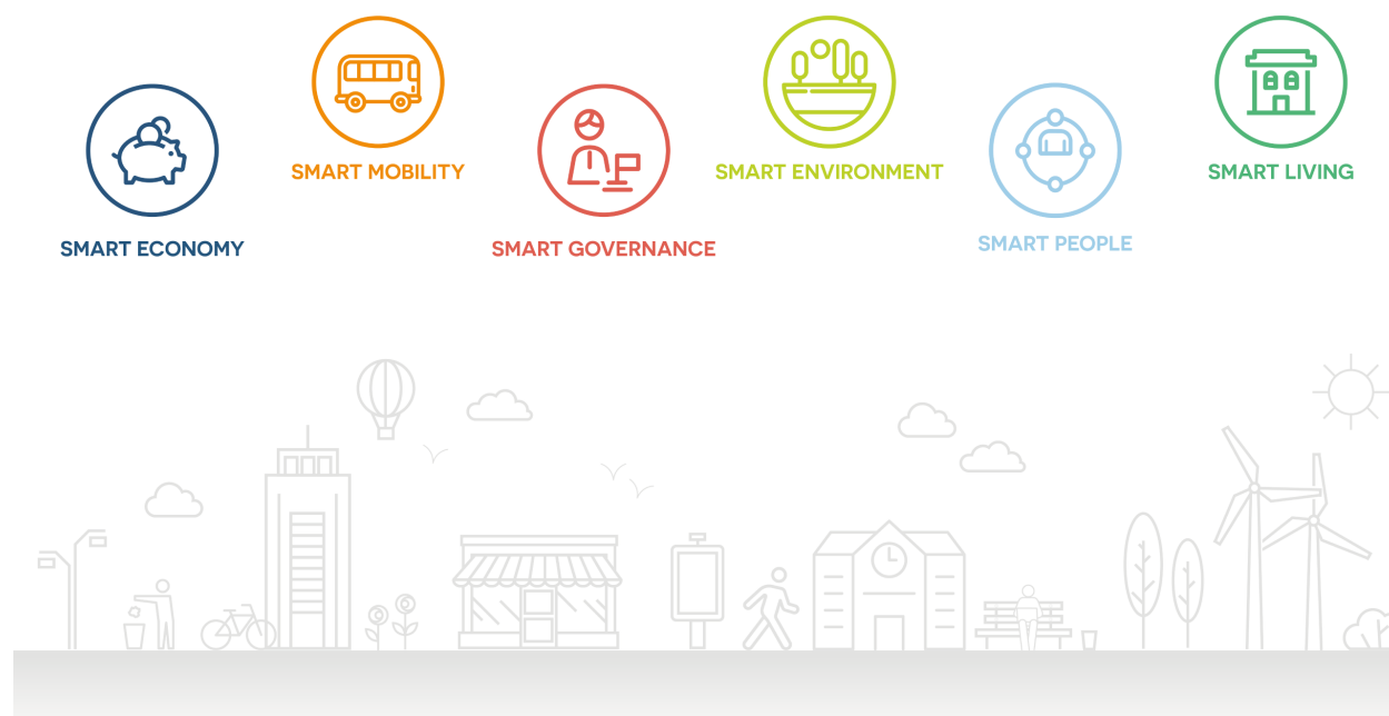
Shema 1: Komponente pametnog grada