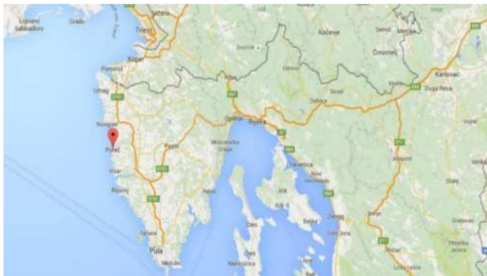
Slika 4 Položaj grada Poreča

Osim dobre prometne povezanosti, dostupnost i sigurnost u destinaciji su važni faktori koji će privući turiste da odaberu baš tu destinaciju. U gradu i na području grada nude se različiti sadržaji koji će zadovoljiti potrebe svakog turista.