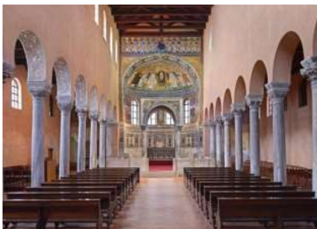
Slika 5 Unutrašnjost Eufrazijeve bazilike

Osim Pule, Poreč je također bio rimska kolonija u Istri. Povijesna jezgra grada je građena više od 2000 godina. Očuvao je raspored ulica iz doba antike u starom gradu. Najduža i poprečna ulica u tom gradu nazivaju se Decumanus i Cardo Maximus. Od društvenih atraktivnih faktora može se izdvojiti Eufrazijeva bazilika iz 6. stoljeća, to je najbolje očuvan povijesni spomenik koji je poznat u cijelom svijetu. Od 1997. godine nalazi se na UNESCO-ovom popisu svjetske kulturne baštine. Unutar same Eufrazijeve bazilike mogu se pronaći spektakularni mozaici i umjetnine koje su stare 15-tak stoljeća.