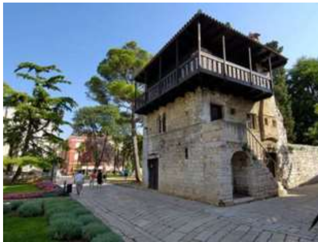
Slika 6 Romanička kuća

Romanička kuća je jedna od najstarijih sačuvanih kuća u Poreču, potječe iz sredine 13. stoljeća. Obnovljena je tek u 20.stoljeću kada je dobila svoj drveni balkon. Zadnjih godina se u prizemlju te kuće prodaju suveniri u ljeti, a na katovima iznad služi za stručnjake iz Zavičajnog muzeja.