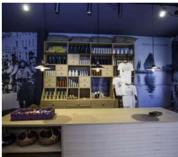
Slika 7 Dio Centra za posjetitelje

Centar za posjetitelje La mula de Parenzo (Djevojka iz Poreča), to je ujedno i naziv za neslužbenu himnu grada. Pjesma je najveće bogatstvo nematerijalne baštine grada, a materijaliziralo se kroz centar za posjetitelje. U centru može se saznati tko je bila „la mula de Parenzo“, čime se bavila te zašto je toliko poznata za ovaj grad? Također može se saznati bezbroj informacija o pjesmi, o samoj povijesti grada s početka 20. stoljeća, o društvenom odnosu u kojem je pjesma nastala, gastronomiji i ribarstvu grada. To je mjesto gdje se povezuju prošlost i sadašnjost, tradicija i tehnologija pomoću fotografija, infografika, starih predmeta te multimedijalnih pomagala.