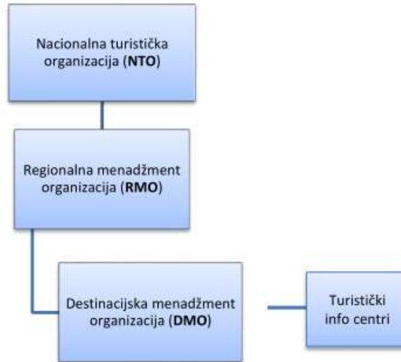
Slika 3 Razine upravljanja turizmom