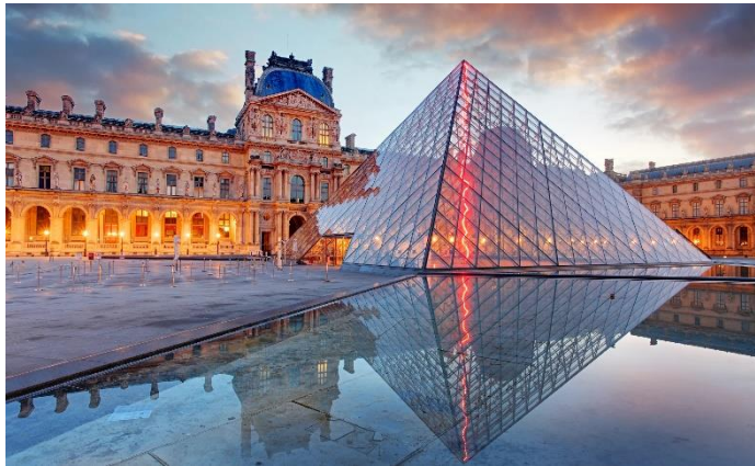
Slika 1: Muzej „Le Louvre“

Samotrake“ skulptura je bez poznatog autora, nije toliko očuvana, no smatra se da postoji još od 190. godine prije Krista te da je podignuta uslijed ratova na području Sirije. Specifičnost ovoga muzeja također je primjetna u njegovom obliku. Naime, muzej je u obliku piramide koja je sastavljena od 603 komada staklenih ploča u obliku romba, te 70 staklenih ploča u obliku trokuta. Sve zajedno, sastavljen je od 673 staklene ploče, te samim svojim izgledom privlači mnoge posjetitelje. 11