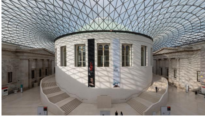
Slika 3: „The British Museum“ ; Izvor: www.visitlondon.com

Značajni muzeji u svijetu, također su oni u Vatikanu, galerija „Uffizi“ u Firenci te muzej „Ermitaž“ u Rusiji i mnogi drugi. U galeriji „Uffizi“ može se istaknuti djelo „Rođenje Venere“ umjetnika Sandro Botticelli-a. „Muzej Ermitaž“ u Rusiji ima širok spektar umjetničkih djela, a može se istaknuti „Povratak razmetnoga sina, umjetnika Rembrandta van Rijna iz 1669. godine. 14