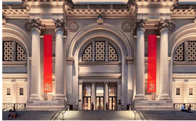
Slika 2: „The Metropolitan Museum of Art“ ; Izvor: www.metmuseum.org

Naime, smješten u području Manhattan-a u New York-u, u ovome su se muzeju kroz godine održavale razne manifestacije. Jedna od njih, a možda i najpoznatija, je „The MET Gala“. Ovaj događaj održava se u svrhu prikupljanja prihoda za njihov institut za izradu kostima i ostalih potrepština za izradu određenih scenografija. Svake godine ovaj događaja ima modnog dizajnera koji isti predvodi, te temu koju uzvanici moraju pratiti. Pripreme za ovakav događaj znaju trajati mjesecima, a sami odjevni predmeti pomno su osmišljeni i izrađeni po mjeri. Tom događaju svake godine pristupe stotine poznatih ličnosti, te je isti moguće pratiti i s malih ekrana.