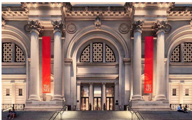
Slika 2: „The Metropolitan Museum of Art“

Naime, smješten u području Manhattan-a u New York-u, u ovome su se muzeju kroz godine održavale razne manifestacije. Jedna od njih, a možda i najpoznatija, je „The MET Gala“. Ovaj događaj održava se u svrhu prikupljanja prihoda za njihov institut za izradu kostima i ostalih potrepština za izradu određenih scenografija. Svake godine ovaj događaja ima modnog dizajnera koji isti predvodi, te temu koju uzvanici moraju pratiti. Pripreme za ovakav događaj znaju trajati mjesecima, a sami odjevni predmeti pomno su osmišljeni i izrađeni po mjeri. Tom događaju svake godine pristupe stotine poznatih ličnosti, te je isti moguće pratiti i s malih ekrana.