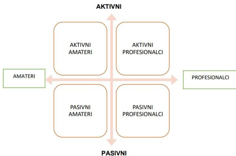
Slika 1. Prikaz pozicioniranja sportskih turista