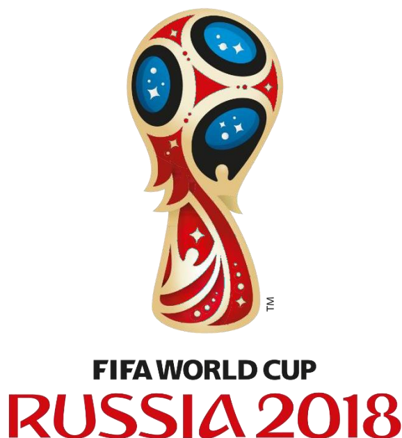
Slika 2. Logotip Svjetskog nogometnog prvenstva u Rusiji 2018. godine