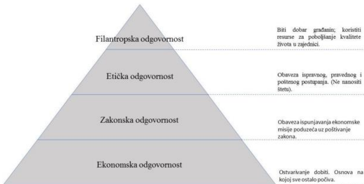
Shema 1. Hijerarhijske razine društvene odgovornosti poslovnoga sustava