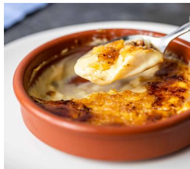
Slika 7. CREMA CATALANA