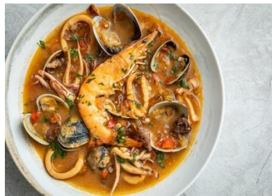
Slika 6. SUQUET DE PEIX