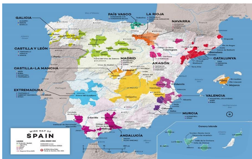
Slika 7, mapa španjolskih vinskih regija

tijela iz Rioje do fantastičnih pjenušavih vina Cava iz Penedesa, vinske regije Španjolske vrijedi posjetiti za vinska putovanja u južnoj Europi.