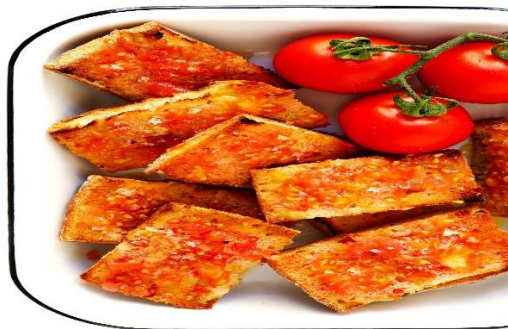
Slika 3. PA AMB TOMAQUET