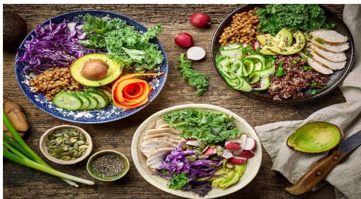
Slika 2. Gastronomski trend, bowls

mogu servirati zdjelice s voćem, kašom ili jogurtom, za pauzu za ručak, primjerice povrće s kus-kusom, dok se navečer može servirati obilan obrok s krumpirom i sirom.