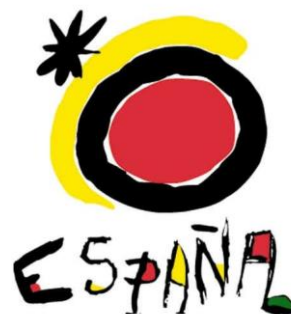
Slika 9. I need Spain brand, travel logo

Kao što je prije naglašeno, na početku je glavni element za promicanje Španjolske bilo njezino odmaralište na suncu i plaži, no istina je da se kulturni i gospodarski globalni položaj Španjolske dramatično poboljšao tijekom proteklih 30 godina i možda bi druge zemlje u usponu trebale obratiti pažnju na različite tehnike koje koristi Španjolska. U vezi s kulturom i tradicijom i među ostalim popularnim aspektima turizma u Španjolskoj, bitno je naglasiti tradicionalne festivale koji se održavaju svake godine u različitim dijelovima Španjolske. Uz sve navedeno, Španjolska je glavno turističko odredište te odiše posebnosti. Njezin imidž je prepoznatljiv svugdje u svijetu te posjeduje zavidnu poziciju na globalnoj turističkoj pozornici.