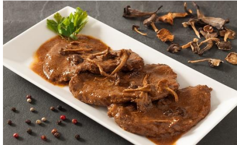
Slika 5. FRICANDO

tradicionalnih katalonskih jela koje svoje porijeklo duguje urbanoj, a ne seljačkoj kuhinji.