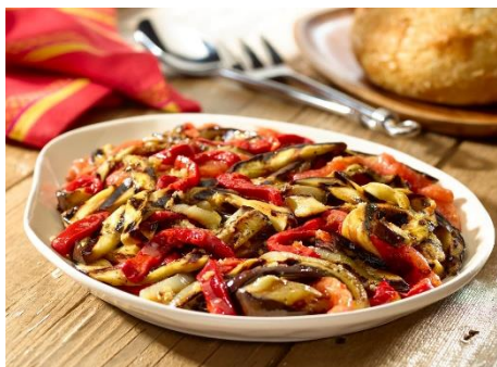
Slika 4. ESCALIVADA

Izvor: Goya. Escalivada - Grilled Summer Vegetables. https://www.goya.com/en/recipes/escalivada (pristupljeno 14. 5.