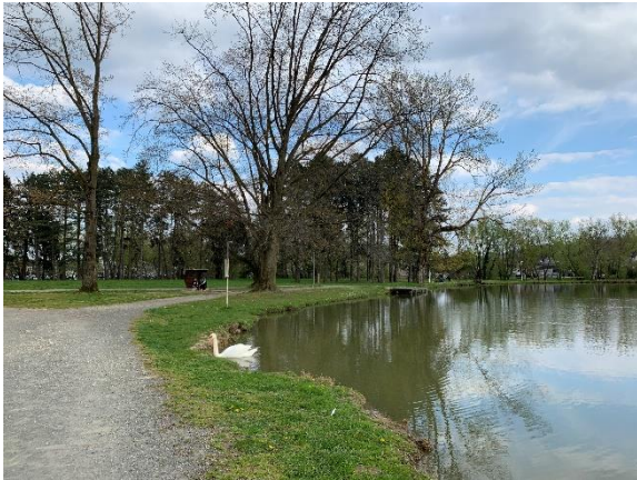
Slika 16 Otok mladosti

Kao prirodne atrakcije potrebno je spomenuti Otok mladosti, šetalište koje se nalazi gotovo u samom centru grada. Otok je reljefna cjelina okružena rijekom Bednjom s južne i istočne strane, a sa sjeverne tzv. Mlinskim kanalom. U posljednjih nekoliko godina flora otoka je u potpunosti uređena te je Otok poprimio izgled mjesta za odmor i rekreaciju za sve uzraste. Na njemu se nalazi uređena Kardio šetnica dr. Tršinskog, sunčališta, pametne klupice, dječje igralište, japanski vrt, jezero s fontanom, a na njemu se također organiziraju i razni kulturni, društveni i turistički sadržaji. Na sljedećim slikama prikazan je krajolik Otoka mladosti.