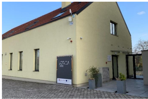
Slika 4 Arheološki park Iovia