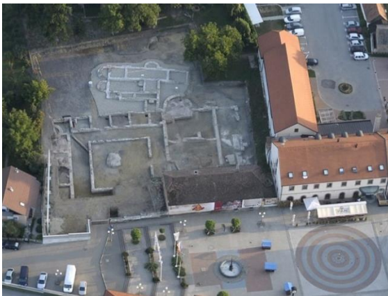
Slika 3 Arheološko nalazište iz zraka

U samom središtu današnjeg Ludbrega nalazi se antičko arheološko nalazište Vrt Somođi, odnosno Rimski Jovija (civitas Iovia – Botivo). Hrvatski restauratorski zavod je proveo sustavna arheološka istraživanja u nekoliko faza u centru Grada te je u cijelosti istražen objekt 1, odnosno Jovijsko kupalište te veći dio objekta 2 koji je organiziran oko pravokutnog nenatkrivenog dvorišta određen sa trijemom sa zapadne strane. 52 Na tom mjestu je 2021. otvoren Arheološki park Iovia u kojem je na suvremeni, multimedijalni način putem AR i 3D interaktivnih modela posjetiteljima omogućen uvid u rimsku kulturu i život na području antičke Iovije. 53 Slikom 3 dan je prikaz arheološkog nalazišta iz zraka gdje se mogu vidjeti spomenuti pronađeni objekti, dok slika 4 prikazuje ulaz u Arheološki park Ioviju.