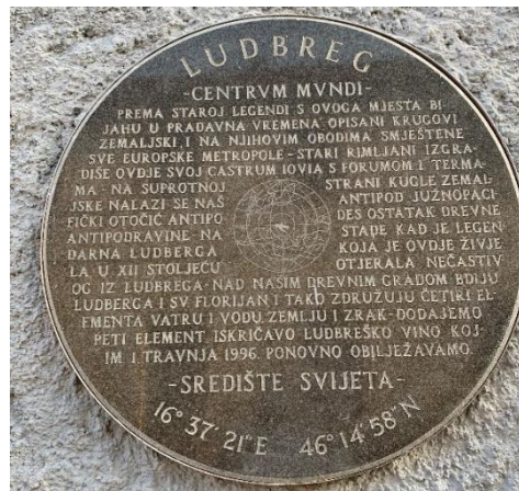
Slika 19 Ploča „Ludbreg-Centrum Mundi“

Družeci se s Ludbrežanima te posjećujući njihove vinograde, zaključio je da se nalazi u samom središtu svijeta. Odlučio je to provjeriti i potvrditi. Uzeo je šestar i na zemljovidu počeo upisivati kružnice sa Ludbregom kao središnjom točkom. Na obodima kružnica pojavili su se svi najveći europski i svjetski gradovi čime je potvrdio svoju teoriju o Ludbregu kao središtu