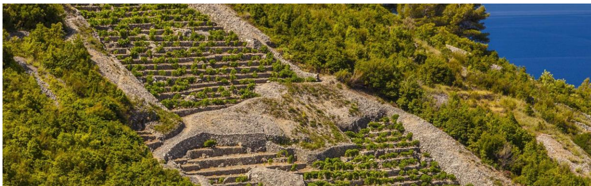
Izvor 5. https://croatia.hr/hr-hr/hrana-i-pice/vugava

Grk je sorta vina koja se uzgaja u vrlo uskom području i isključivo na području Korčule oko Lumbarde te je riječ o vrlo malom i specifičnom položaju. Lumbarajsko polje je okruženo morem sa svih strana i na maloj je nadmorskoj visini pa je vinova loza često izložena posolici, a tla su duboku pijesci što daje vrlo specifične uvjete za rast i razvoj. Grk je snažnog i uspravnog rasta te dobre otpornosti na bolesti i štetnike. Ima funkcionalno ženski cvijet pa mu treba oprašivač za kojeg služi plavac mali ili rukatac i upravo zbog toga je oplodnja neredovita pa o tome i ovisi rodnost iz godine u godinu. Vina su nježne žućkaste