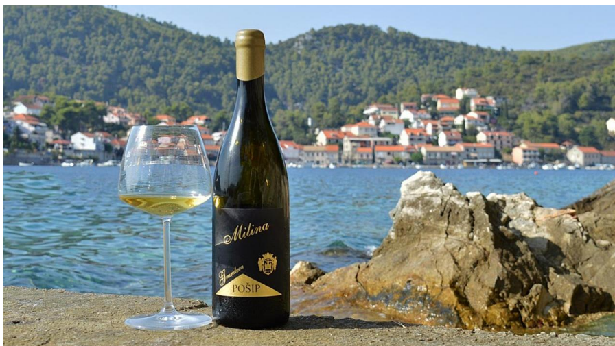
Slika 4. Korĉulanski pošip