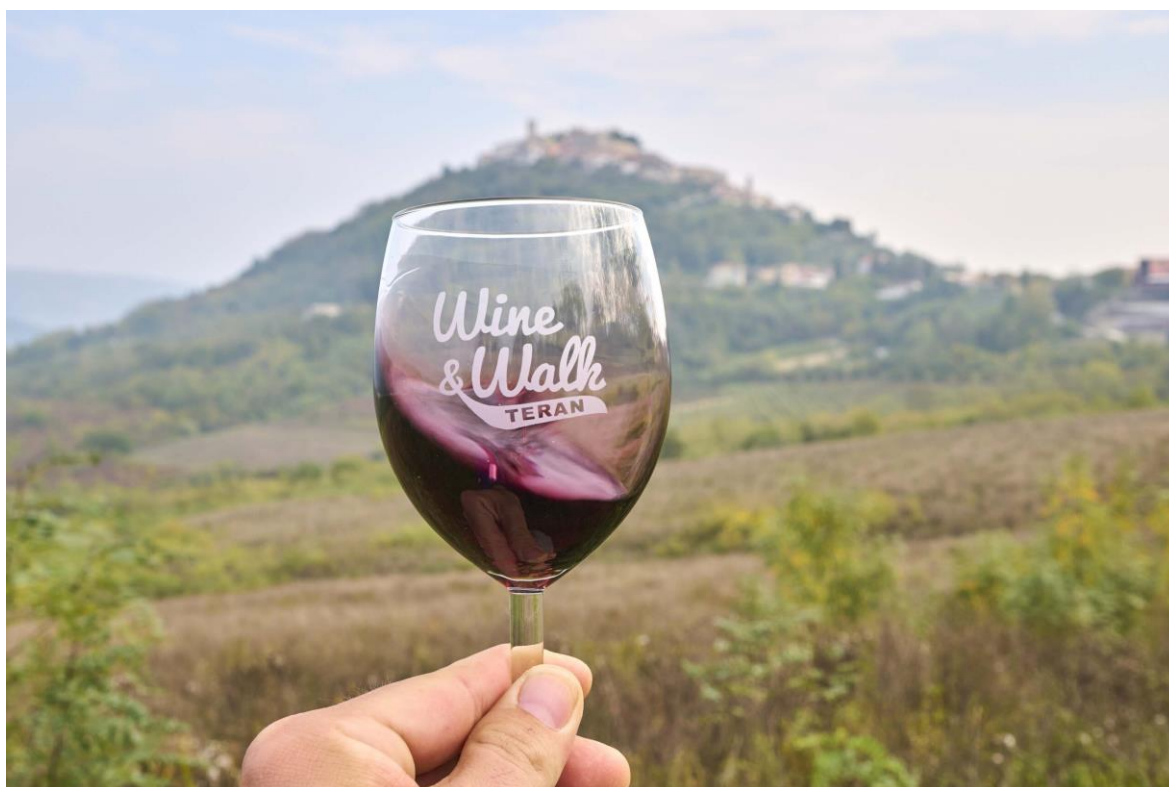
Slika 7. Ljubičasta boja sorte terana