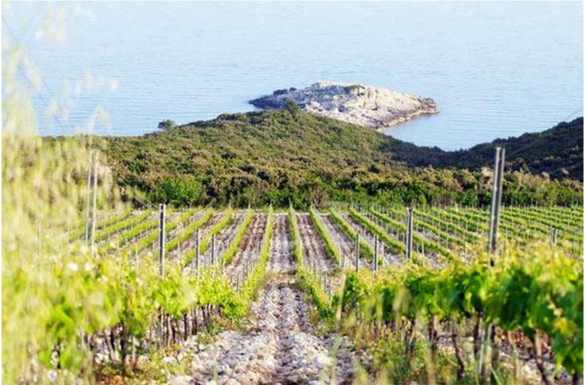
Slika 6. Vinogradi sorte grk na Korčuli, Lumbarda