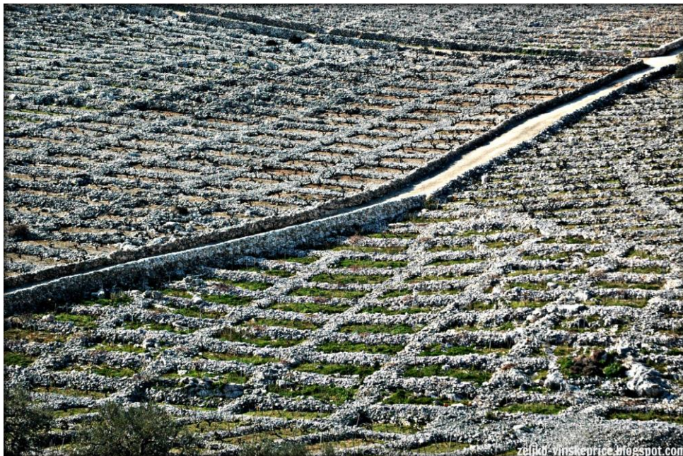
Slika 3. Bucavac područje sorte babiće