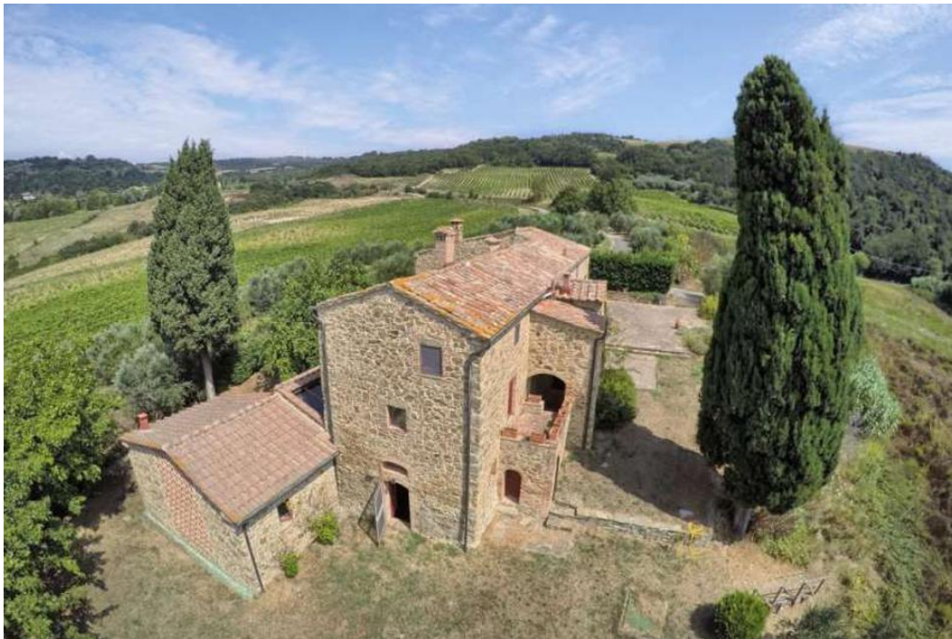
Slika 2. Primjer ruralne kuće u Toskani

gastronomске i druge ponude. Toskana obuhvaća strogu zakonsku regulativu s kojom čuvaju tradicionalni način života. U većini područja nije dozvoljena nova gradnja, jedino renovacija starih kuća koja mora biti izgrađena po određenim uvjetima, kao što su: korištenje opeke, drvene grede, prozore i vrata i slično. Istra i dalje nema posebnih uvjeta za izgradnju građevina, stoga se u brojnim područjima izgrađuju kuće modernog stila koje narušavaju ruralni izgled cijele destinacije.