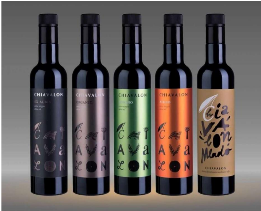
Slika 4. Chiavalon maslinovo ulje