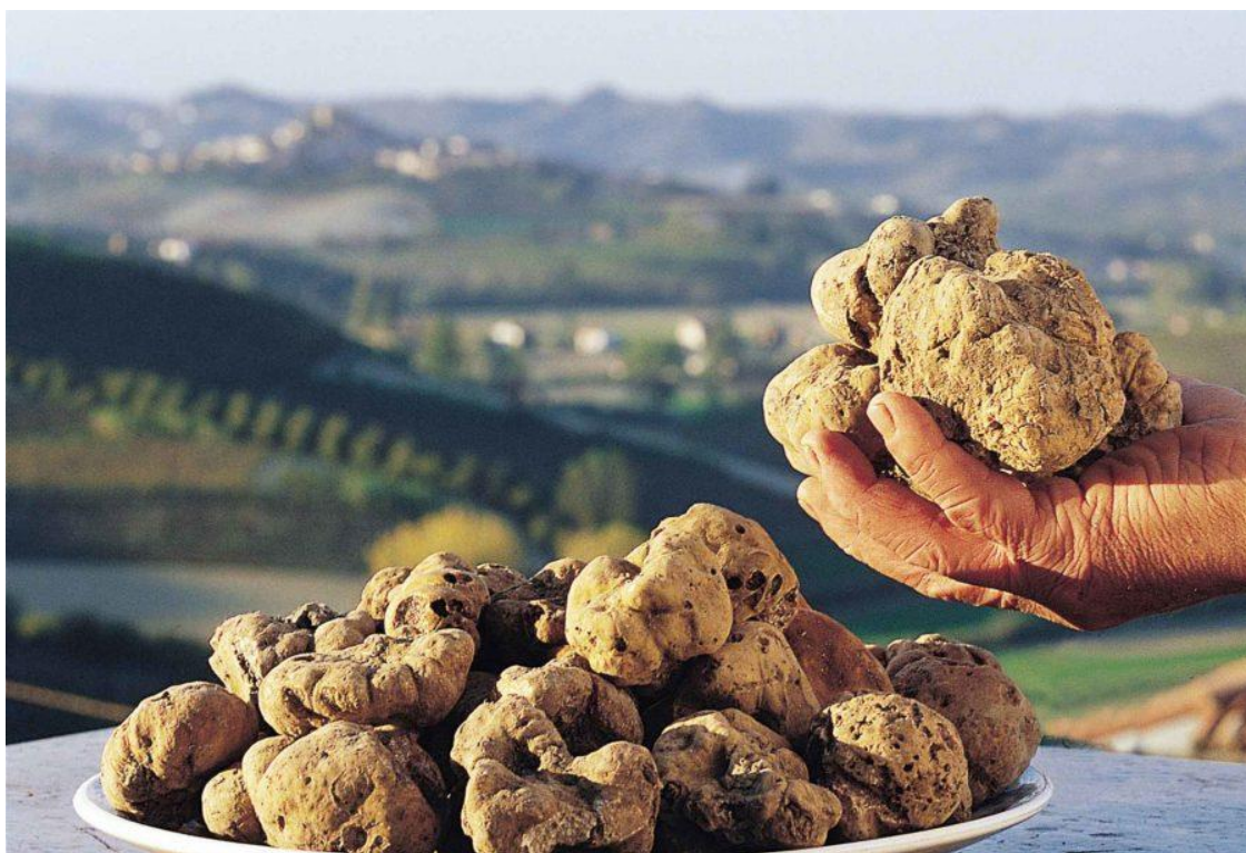
Slika 3. Istarski bijeli tartufi