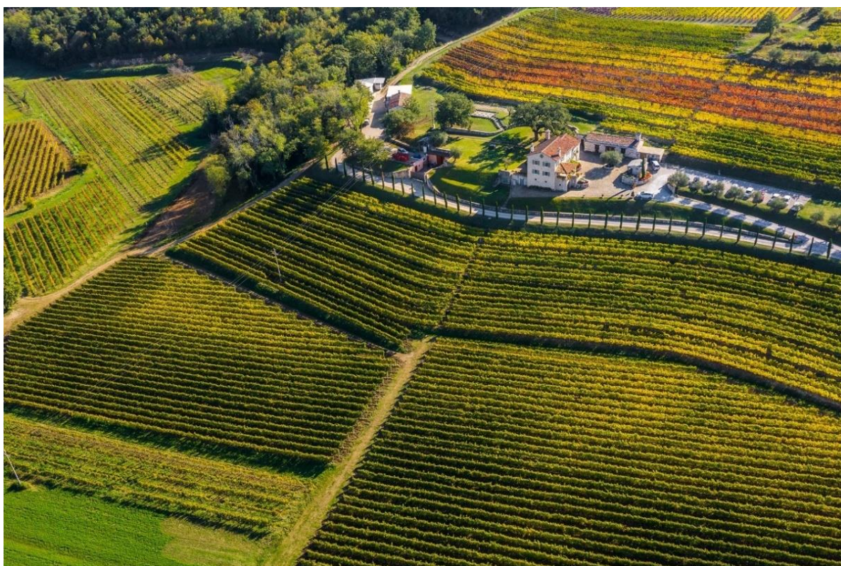
Slika 5. Primjer jedne vinarije u Istri

Jedino imanje u Hrvatskoj gdje su zajedno nastali dvorac i vinarstvo. Dvorac Belaj imao je dugu povijest, ali danas u sklopu cijeloga imanja djeluju dvije Vinarije; Podrum Belaj te Dvorac Belaj. Osim povijesnog vinograda i dvjema vinarijama, nude i spektakularan prostor za događaje i evente. Osim toga u ponudi imaju i stručna vođenja kroz dvorac i vinograde te degustaciju uz stručne sommeliere. 27