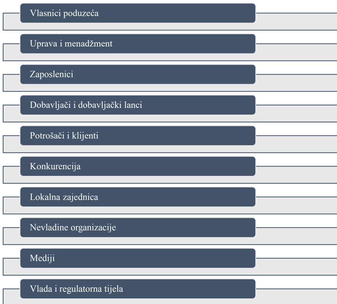
Shema 3 - Dionici društveno odgovornog poslovanja