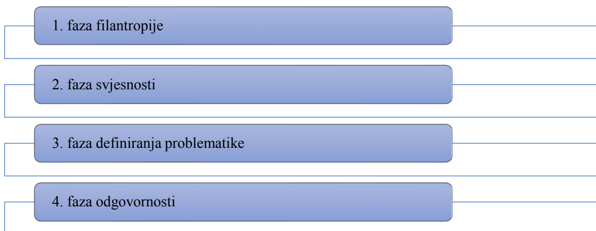
Shema 4 - područja društveno odgovornog poslovanja

Izvor: Vlastita izrada prema: Carroll, A.B. „A History of Corporate Social Responsibility“, Oxford University Press, 2008., str. 26