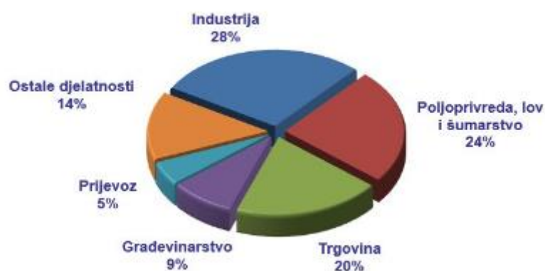
Grafikon 1. Ukupni prihodi trgovačkih društava Osječko – baranjske županije u 2019. godini

Izvor: Hrvatska gospodarska komora - https://www.hgk.hr/zupanijska-komora-osijek/gospodarski-profil-zupanije (pristupljeno 02.05.2023.)