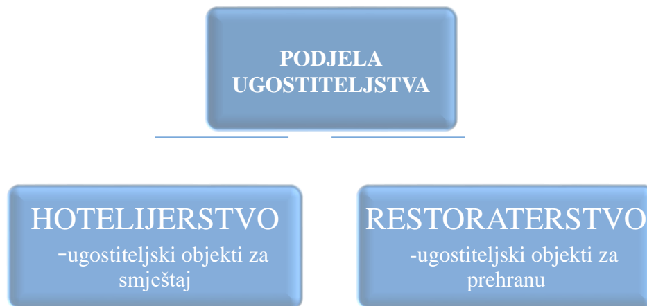
Shema 1: Podjela ugostiteljstva