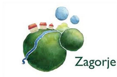
Slika 2. Logotip brenda „Zagorje-bajka na dlanu“ 13

Kao jedna od najljepših i najzanimljivijih regija u Hrvatskoj, Hrvatsko zagorje ima mnogo toga za ponuditi turistima, od prekrasnih prirodnih ljepota, kulturnih i povijesnih znamenitosti, do tradicionalnih običaja, gastronomske ponude te mnogih drugih atrakcija. Glavni preduvjet za uspješan imidž destinacije je da bude jedinstven i drugačiji od svojih konkurenata. Krapinsko-zagorska županija stvorila je svoj promocijski slogan za Zagorje koji glasi „Zagorje-bajka na dlanu“. Ovaj brend dočaran je kao čarolija bajkovitog dlana. Vizualni identitet prikazuje dvije zelene kugle te one predstavljaju brežuljke, livadu, polja te ta kugla podsjeća na oblik planeta Zemlje. Na kugli se nalaze i male kućice te rijeka koja teče pored njih. Logotip djeluje smirujuće i opuštajuće jer slogan zvuči kao savršeno mjesto kao iz neke bajke.