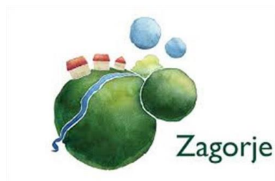
Slika 2. Logotip brenda „Zagorje-bajka na dlanu“ 13

Kao jedna od najljepših i najzanimljivijih regija u Hrvatskoj, Hrvatsko zagorje ima mnogo toga za ponuditi turistima, od prekrasnih prirodnih ljepota, kulturnih i povijesnih znamenitosti, do tradicionalnih običaja, gastronomske ponude te mnogih drugih atrakcija. Glavni preduvjet za uspješan imidž destinacije je da bude jedinstven i drugačiji od svojih konkurenata. Krapinsko-zagorska županija stvorila je svoj promocijski slogan za Zagorje koji glasi „Zagorje-bajka na dlanu“. Ovaj brend dočaran je kao čarolija bajkovitog dlana. Vizualni identitet prikazuje dvije zelene kugle te one predstavljaju brežuljke, livadu, polja te ta kugla podsjeća na oblik planeta Zemlje. Na kugli se nalaze i male kućice te rijeka koja teče pored njih. Logotip djeluje smirujuće i opuštajuće jer slogan zvuči kao savršeno mjesto kao iz neke bajke.