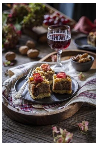
Slika 3. Svečana martinjska pita