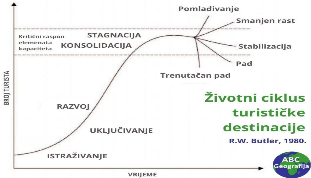
Slika 1. Životni ciklus destinacije