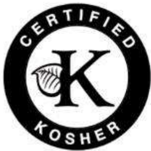
Slika 1. Košer certifikat