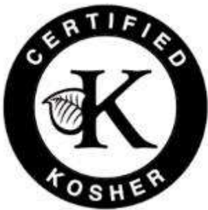
Slika 1. Košer certifikat