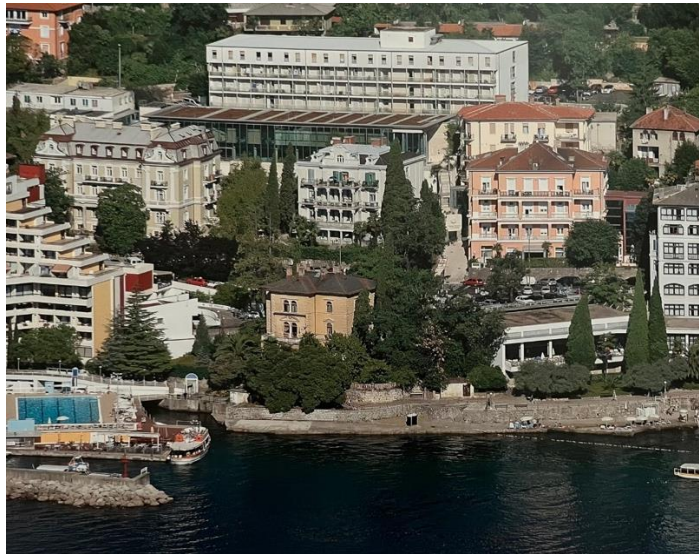
Slika 3. Kompleks zgrada Thalassotherapije

Izvor: Bratović, Thalassotherapia Opatija , 122.