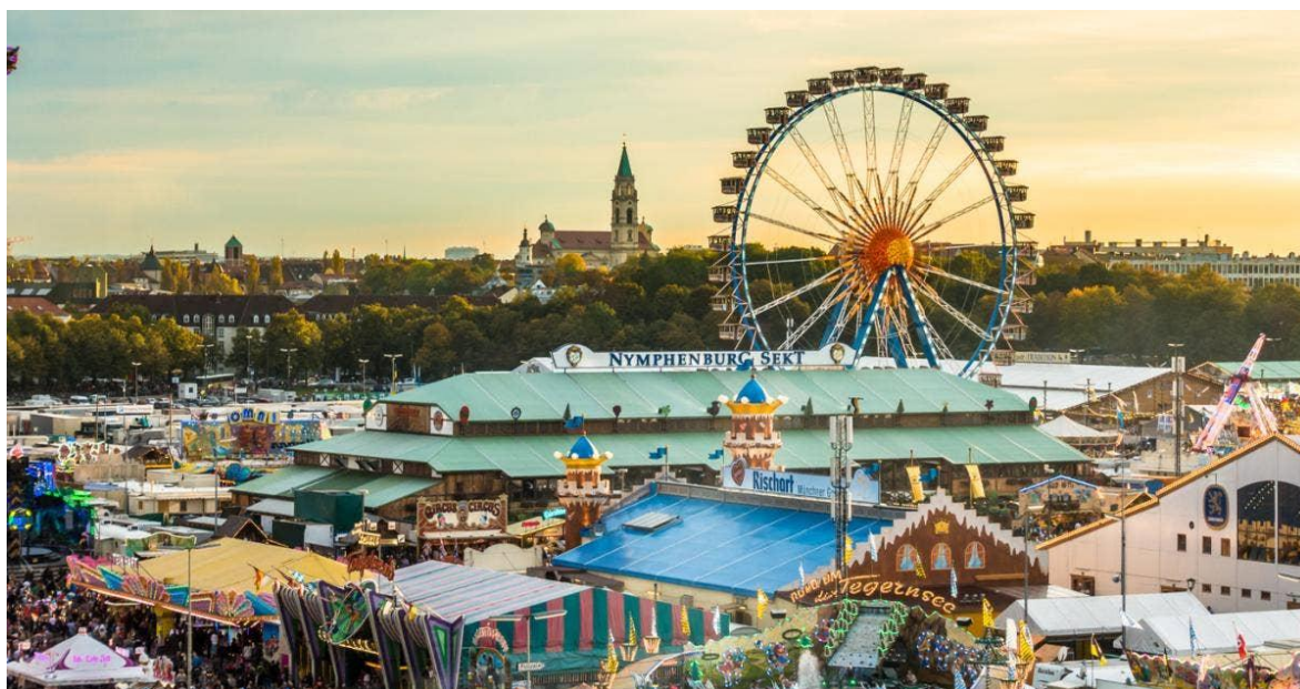
Slika 2. Oktoberfest