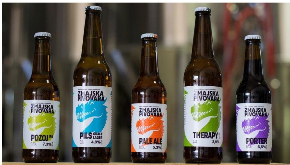
Slika 1. Primjer craft piva

Na slici 1. je prikazan primjer craft piva.