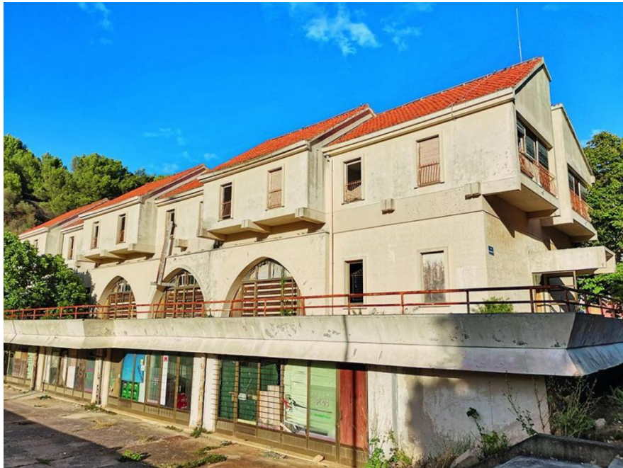
Slika 17. Napuštena zgrada vojnog hotela “Sirena”

Što se tiče ostalih vojnih objekata, vojna zona s radarom na Humu je u vlasništvu Hrvatske vojske te je i dalje u funkciji. Vojni stanovi u Ublima su podijeljeni vojnicima s obitelji, dok se vojni dom preuredio za potrebu općine, kao što je funkcija izborne jedinice za državne izbore te prostor okupljanja umirovljenih vojnih branitelja. Također, u Ublima se nalazi napuštena zgrada vojnog hotela “Sirena”, gdje su boravili vojnici do 1995. g. Kompleks vojnih građevina i tunela u uvali Perna je netaknut i bez funkcije, zbog čega privlači brojne turiste i istraživače. Postoje ostaci vojnih osmatračnica iz doba Slavena koji se mogu naći na uzvišenim dijelovima otočja, dok se u starom ribarskom naselju Lučica može naći vojna baterija iz doba vladavine Francuske i Austrije. 41