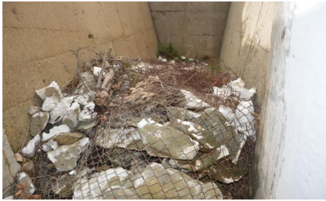
Slika 13. Otpad na sporednom izlazu velikog vojnog bunkera