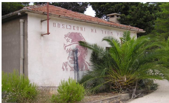
Slika 6. Napuštena zgrada u vojarni “Maršal Tito”

Kasarna “Maršal Tito” (Maršalka) je izgrađena iznad mjesta Uble u borovoj šumi 1970-ih. Prihvatni kapacitet je bio za oko 200 vojnika, a kasarna je sadržavala ambulantu, kompleks zgrada za stanovanje, streljane za vojnu obuku te radionicu za servis automobila, kamiona i vojna vozila. Također, nalazili su se odbojkaški i teniski tereni za rekreaciju, a u neposrednoj blizini se nalazio svinjac kojega su održavali vojnici u svrhu prehrambene opskrbe. 16