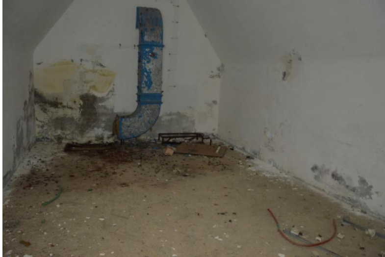
Slika 12. Derutno stanje prostorije u velikom vojnom bunkeru