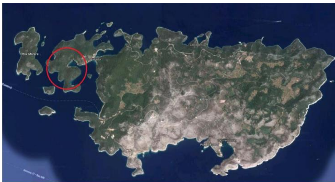
Slika 8. Geografski položaj uvala Jurjeve luke i Kremene na Lastovskom otočju

Na južnom dijelu otoka Prežbe nalaze se uvale Jurjeva luka i Kremena koje služile kao pomorsko-vojno pristanište sa streljanom 50-ih, a kasnije kao i policijska zgrada i bolnica 60-ih i 70-ih godina prošloga stoljeća. Danas je taj kompleks zapušten i neiskorištenog potencijala. Ministarstvo državne imovine 2019. g. je ispisalo javni poziv za podnošenje ponuda za osnivanje prava građenja te za koncesiju za luke nautičkog turizma i plaže. Općina Lastovo je kreirala urbanistički plan obnove “Jurjeva luka-Kremena” 2017.g., ali zbog određenih prepreka u implementaciji, projekt je i dalje na čekanju. Prostor obuhvaća uglavnom neizgrađeni prostor prekriven borovom šumom sa zapuštenim vojnim građevinama, skladištima i pomorskim pristaništem u Jurjevoj luci te zapuštenim vojnim potkopom u Kremeni. Prostor obuhvata nije infrastrukturno opremljen, ali je do uvala Jurjeva luka, za potrebe nekadašnjih vojnih građevina, preko naselja Pasadur dovedena osnovna infrastruktura (prometnica, vodoopskrba, elektroopskrba). Ista nije dostatna za daljnji razvoj u prostoru obuhvata, stoga će biti potrebno racionalno riješiti pitanje kompletne infrastrukture (promet, elektroopskrba, vodoopskrba i odvodnja) u skladu s određenim propisima i odredbama.