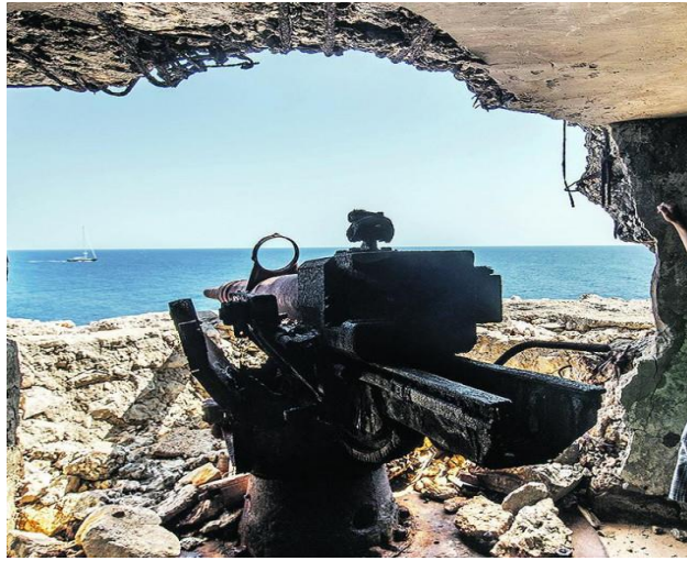
Slika 4. Obalni top 80 mm u Veljem moru

tri stražarska mjesta sa zajedničkim nazivom “Kota 101”, a u uvali Perna su se nalazile zgrade za tridesetak vojnika i 10 nižih oficira za stražarenje. 14