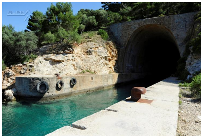
Slika 7. Vojni tunel na otoku Mrčari

dijelovima te protuavionska obrana koju su čuvali oficiri. Oko 1986. g., doneseni su mufloni s ciljem razmnožavanja jer se smatralo da je Mrčara ima slično stanište kao i Korzika (odakle su i doneseni). U najluksuznijim zgradama su boravile starješine s obiteljima sve dok se za njih nisu izgradili stanovi na ulazu u mjestu Uble. U ostalim zgradama su se skladištila municija i hrana, a luka je služila za opskrbu i privez vojnih brodova i patrolnih čamaca. Na Mrčari se nalazila velika lokva gdje su se uzgajali voće i povrće. Sve vojne zone na Lastovu, pa tako i Mrčara, bile su samoodržive, što podrazumijeva vlastitu vodu iz gusterne te generatore i agregate za struju. 17