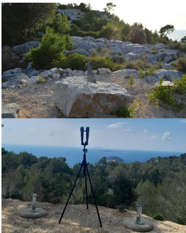
Slika 15. Prikaz instalacije sunčanog sata i originalnog vojnog periskopa