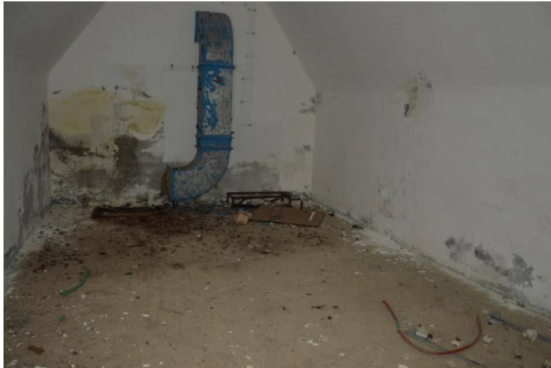
Slika 12. Derutno stanje prostorije u velikom vojnom bunkeru