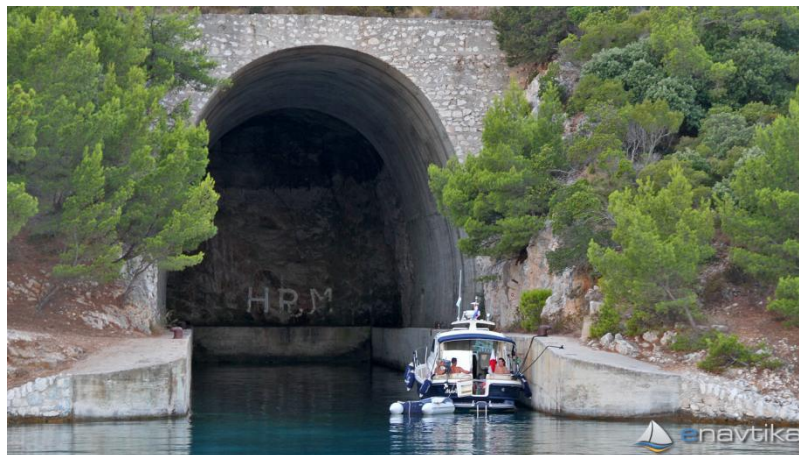
Slika 10. Vojni tunel u uvali Kremen

parkiranja. Luka nautičkog turizma (LN) ima površinu 9,4 ha i 400 vezova te se sastoji od kopnenog dijela s osnovnim i pomoćnim građevinama s ugostiteljskom, trgovačko-uslužnom i športsko-rekreacijskom namjenom. Morski dio (akvatorij) se sastoji od uređene obale s polerima za privez u primjerenim razmacima te od gatova, valobrana i lukobrana. Vezovi sadrže ormariće s instalacijama za vodu, struju i kabelsku kanalizaciju. Izgradnja gatova neće ometati morski pristup vojnom tunelu koji će imati funkciju turističke atrakcije. Za izgradnju hidroavionskog pristaništa od 0,7 ha potrebna je gradnja na kopnenom i pripadajućem morskom dijelu, i to: operativne i servisne površine, poletno-sletne staze, pontona i ostalih objekata s pripadajućom instalacijom i opremom. Pristanište je predviđeno za javni hidroavionski prijevoz s lokalnim značajem mjesta Pasadur te će funkcionirati kao izdvojeni dio luke. Ukupna površina javnih zelenih površina i infrastrukturnog sustava ove zone iznosi 1,4 ha. 29