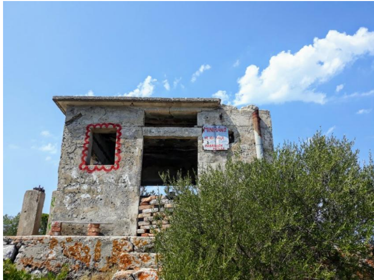
Slika 5. Vojna kućica za stražarenje na Jurjevom vrhu