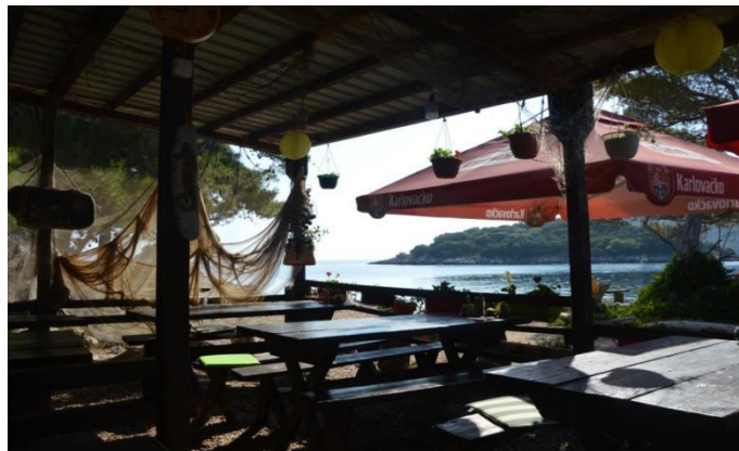
Slika 16. Konoba “Mrčara”

Na otočiću Mrčari nalazi se lovački dom “Morski konjic” u vlasništvu splitskog privatnika. U sklopu doma, na istočnoj strani otoka uz lukobran za pristanište brodova, nalazi se mala konoba “Mrčara” s vanjskom terasom gdje je moguće kušati mediteranska jela uz lokalne proizvode. U blizini restorana, nalaze se četiri drvene kućice s dva do četiri ležajeva, kupaonicama i pogledom na more, s mogućnost polupansiona. U središnjem dijelu otoka, na području bivše vojarnje, nalazi se prostor za paintball koji se iznajmljuje gostima tijekom godine. 40