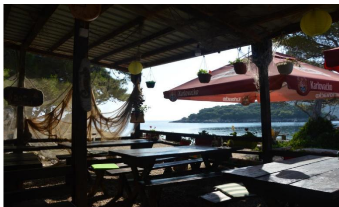
Slika 16. Konoba “Mrčara”

Na otočiću Mrčari nalazi se lovački dom “Morski konjic” u vlasništvu splitskog privatnika. U sklopu doma, na istočnoj strani otoka uz lukobran za pristanište brodova, nalazi se mala konoba “Mrčara” s vanjskom terasom gdje je moguće kušati mediteranska jela uz lokalne proizvode. U blizini restorana, nalaze se četiri drvene kućice s dva do četiri ležajeva, kupaonicama i pogledom na more, s mogućnost polupansiona. U središnjem dijelu otoka, na području bivše vojarnje, nalazi se prostor za paintball koji se iznajmljuje gostima tijekom godine. 40