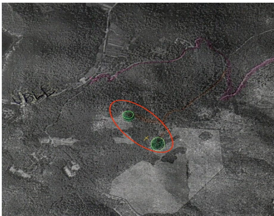
Slika 11. Arkod vojne lokacije “Zminjaš do”