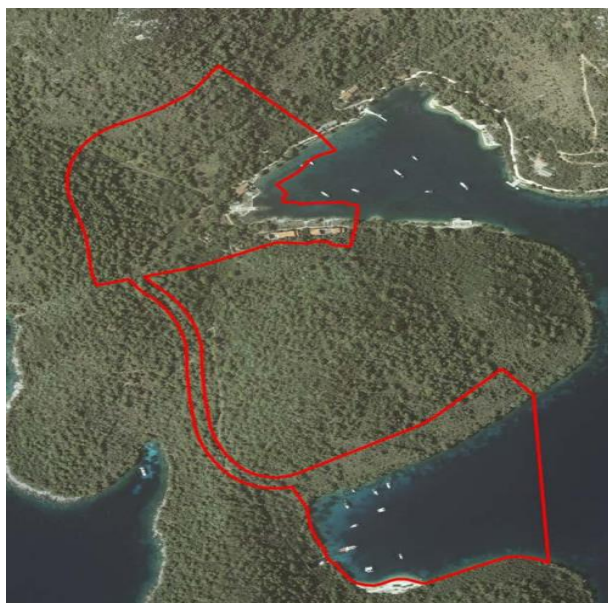
Slika 9. Prostorni obuhvat turističke zone T1 Jurjeva Luka i luke nautičkog turizma LN Kremene

uzimajući u obzir zakonske odredbe kojima se štiti kopneni i morski dio otoka te kulturne vrijednosti lokalnog stanovništva. 27