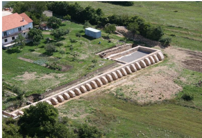
Slika 1. Rimski tilurij u Trilju

svjetskih ratova, Hladnog rata te mnogobrojnih građanskih i domovinskih ratova. Veliki broj vojnih objekata potječe iz prošloga stoljeća, ali jedni od najstarijih ostataka vojne baštine potječu još iz doba stare Grčke, Egipta i Rima. Radi se o starim osmatračnicama (tilurij) koje su omogućavale vojnicima nadzor nad svojim posjedom, posebice preko rijeke ili uzvisine. Uz to, postoji veliki broj rimskih vojnih logora (castrum) na području Europe (posebno Hrvatske) koje su služile za prihvataj vojnika za vrijeme vojnih misija. Jedan od najpoznatijih sustava tamnica u antici su amfiteatri u kojima su se odvijale borbe robova (tzv. borba gladijatora). U prošlosti su nastajali gradovi pod utvrdom, gdje je tako vojna baština obuhvaćala cijeli lokalitet. Često su bili spomenuti u književnim djelima kao što su Homerovi epovi gdje se spominje antički grad Troja i Trojanski rat. Također, u izraelskoj književnosti se spominje antički grad-utvrda Masada zaštićen od strane UNESCO od 2001. g. Motivi vojne baštine u primijenjenoj umjetnosti pod zaštitom UNESCO nisu česti, ali se mogu pronaći u određenim kulturama (indijska i slavenska). 3