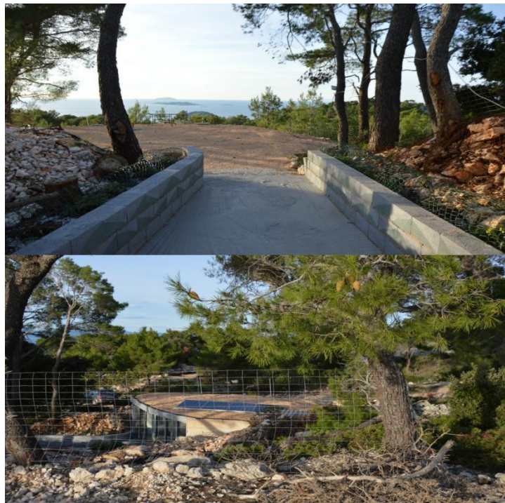
Slika 14. Prikaz recepcije sa solarnim panelima i terasom

se opremili sa eksponatima, raznim namještajima i uređajima iz doba Jugoslavije, pomorskim kartama, lutkama i slično. Što se tiče okoliša, na glavnom ulazu u područje su se postavile tablice usmjerenja ka vidikovcima, bunkerima, recepciji, poligonu i ostalim atrakcijama. Svaki vidikovac se opremio sa starim automobilskim sjedalima i drvenim klupama, a iznad recepcije se izgradila jednostavna metalna instalacija sunčanog sata. Preko puta recepcije se kreirao vojni poligon iznad kojega se postavio vodospremnik.