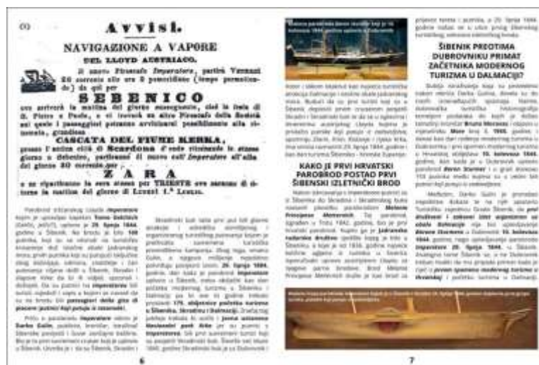
Slika 3: Članak iz VOLIM ŠIBENIK, broj 33. 25