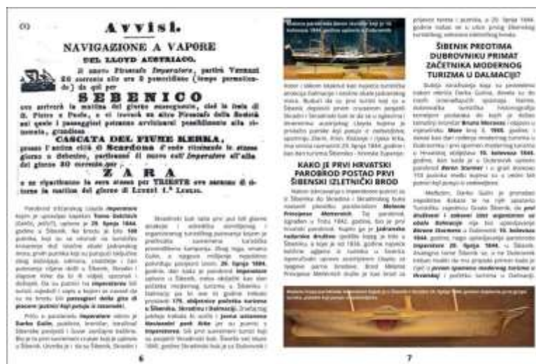
Slika 3: Članak iz VOLIM ŠIBENIK, broj 33. 25