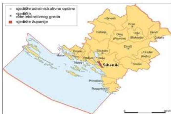
Slika1: Opća geografska karta Šibensko-kninske županije 3

Rad sadrži uvod, osam poglavlja i zaključak. Prvo poglavlje bavi pojašnjenjem pojma turizma te prikazuje turizam u globalnom i nacionalnom kontekstu. Drugo poglavlje donosi općenite informacije o Šibensko-kninskoj županiji, uključujući smještaj, reljef, stanovništvo, klimu, prometnu povezanost, gospodarstvo i povijesni razvoj. Treće poglavlje detaljno opisuje glavna turistička odredišta županije, dok se četvrto bavi kulturnim spomenicima. Peto poglavlje istražuje prirodnu baštinu regije. U šestom poglavlju su predstavljene manifestacije koje se održavaju u županiji, dok se sedmo poglavlje fokusira na nautički turizam. Konačno, osmo poglavlje ističe razvojne ciljeve Šibensko-kninske županije.