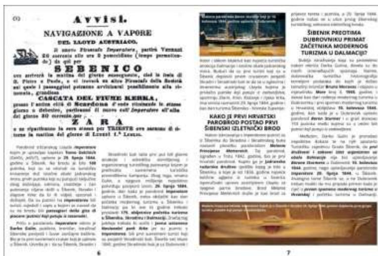
Slika 3: Članak iz VOLIM ŠIBENIK, broj 33. 25