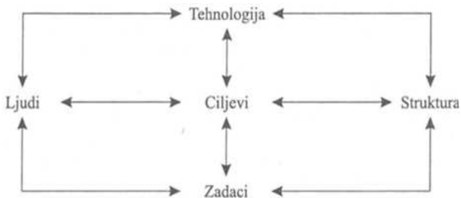
Slika 2. Međusobni odnos unutarnjih čimbenika organizacije