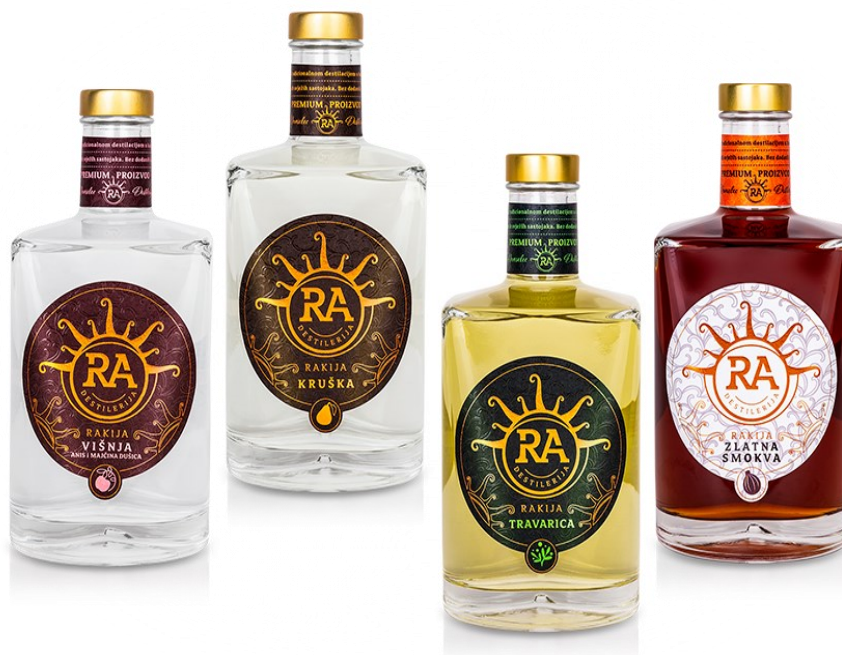
Slika 3. Premium proizvodi Destilerije Ra