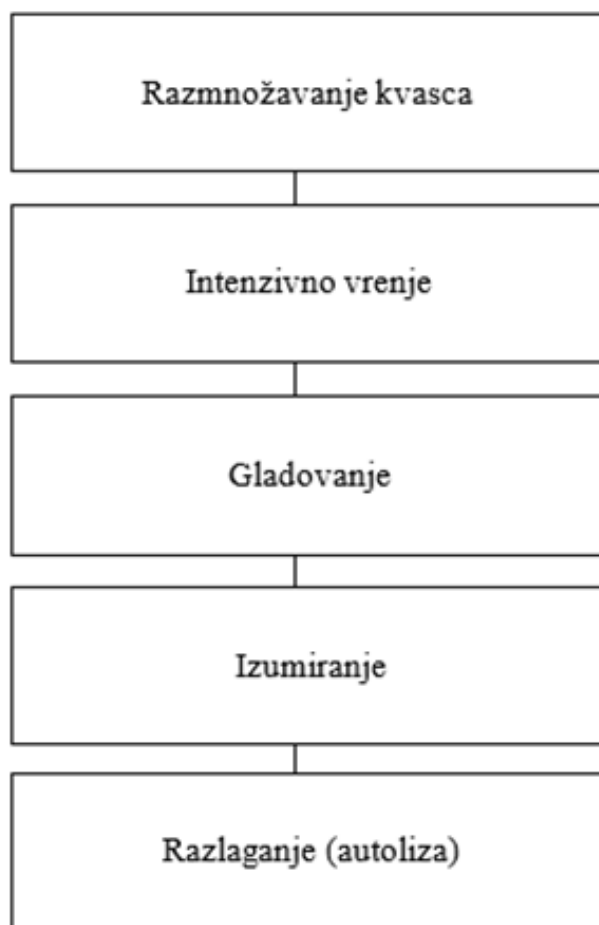
Slika 2. Životni ciklus kvasca

Kvasci, lat. Saccharomyces cerevisiae , su jednostanični mikroorganizmi koji pripadaju skupini gljiva. Oni se prirodno pojavljuju na voću, te se mogu umnožiti u komini voća, no potrebno ih je kontrolirati kako bi se spriječili nepoželjni mikroorganizmi i osigurala kvalitetna fermentacija (Banić 2006, 29). Životni ciklus kvasca sastoji se od sljedećih faza: razmnožavanje, intenzivno vrenje, gladovanje, odumiranje i razlaganje.