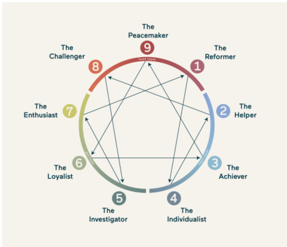
Slika 2. Dijagram eneagrama