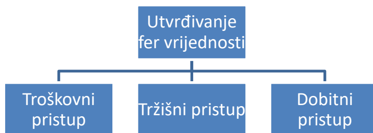
Slika 1. Načini utvrđivanja fer vrijednosti imovine

Troškovni pristup često se naziva i tekućim troškom zamjene odnosno prilikom troškovnog pristupa utvrđivanja vrijednosti vrijednost imovine procjenjuje se temeljem troška zamjene za imovinu koja ima jednak uslužni kapacitet kao i promatrana imovina tj. vrijednost se ogleda u trošku koji bi imao potencijalni kupac imovine ili trošku izgradnje zamjenske imovine koja ima sličnu korist kao zastarjela imovina. Ovakav pristup najčešći je kod utvrđivanja fer vrijednosti imovine koja se koristi u kombinaciji sa drugom imovinom ili drugom imovinom i drugim obavezama. Troškovni pristup također se može koristiti i kao provjera jednog od ostalih pristupa utvrđivanja fer vrijednosti. Dok je kod troškovnog pristupa glavni segment promatranja trošak, kod tržišnog pristupa promatraju se cijene i ostale relevantne informacije iz tržišnih transakcija, uspoređuje se sa identičnom ili makar usporedivom imovinom i obvezama ili skupinom imovine i obveza. Za tržišni pristup često se koriste tržišni multiplikatori izvedeni iz usporedivih vrijednosti, te matrica cijena koja uzima u obzir tržišne cijene promatrane imovine na aktivnom odnosno neaktivnom tržištu te dobivene vrijednosti korigira za razlike ovisno o stanju, kapacitetu određene imovine i sl.