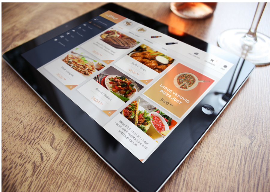
Slika 3. Primjer digitalnog jelovnika u restoranu visoke gastronomije