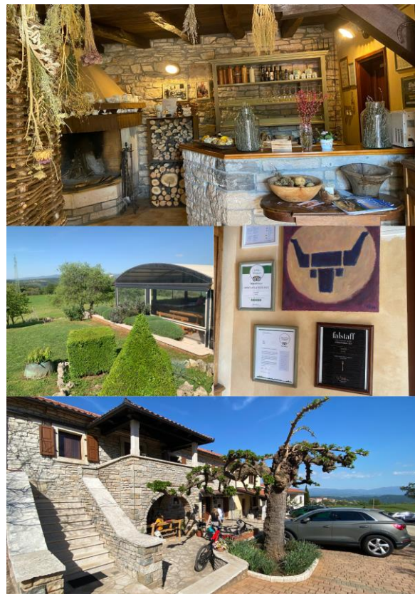
Slika 5: Agroturizam Tončić