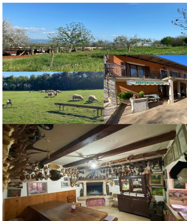
Slika 6: Agroturizam Gardina

koja se u studenom održava već trinaest godina zaredom , a s ciljem promocije lokalnih agroturizama. Odabrani agroturizmi, njih deset koji se svake godine mijenjaju, predstavljaju svoja jela posjetiteljima. U 2023. godini promotivna cijena menija za posjetitelje iznosila je 23 eura, što je uključivalo aperitiv, predjelo, glavno jelo, salatu te desert. Osim predstavljanja hrane, posjetitelji mogu sudjelovati u raznovrsnim radionicama za sve uzraste. 71 Što se tiče smještajnih objekata, iste pružaju isključivo lovcima koji dolaze u lov u Istru, odnosno imaju sobe koje iznajmljuju lovcima. Razlog tome su upravo prije spomenuti korijeni vlasnika u lovu te njegova ljubav prema istome. No, u njihov restoran može doći svatko, a idealno je za mlade obitelji kako bi se djeca mogla upoznati sa seoskim načinom života te domaćim životinjama. Ono što je također ključ uspjeha ovog agroturizma, a što nije ponavljajući “obrazac” kod drugih agroturizama, jest upravo cijena. Vidljivo je kroz recenzije da su gosti izuzetno zadovoljni s razinom usluge, količinom hrane, krajolikom, ali najviše cijenom koju na kraju plate za sve to. 72 Ustrajnost i zajednički naponi ove obitelji osigurali su im lijep život s kvalitetnim poslovanjem, a potencijal za razvoj je izuzetan. Pomalo vlasnici predaju “uzde” vlasti svojim sinovima i unucima kako bi nastavili s radom 73 , te ih uče kako adekvatno voditi posao i istovremeno se brinuti o imanju.