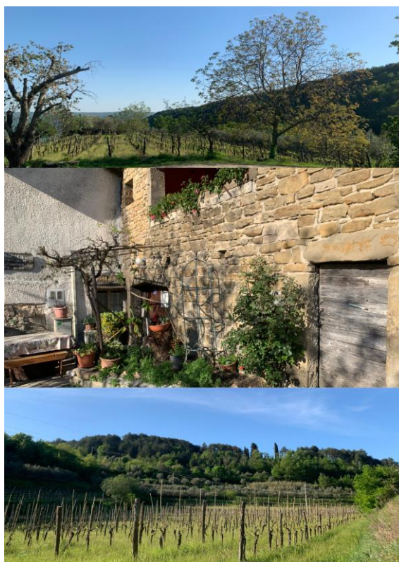
Slika 4: Agroturizam Monticello

Iako je obitelj glavni faktor svakog obiteljskog poljoprivrednog gospodarstva, ovdje je to baš naglašeno. Uz mnoštva obaveza koje se nalaze na ovome imanju, ova obitelj već više od dvadeset godina naporno radi kako bi svojim gostima priuštili jedno mirno i predivno iskustvo boravka u Istri. Nekolicina članova obitelji koja se ovime svakodnevno bavi ulaže mnogo truda kako bi iz “dana u dan” bili sve bolji, a njihovi gosti sve zadovoljniji.