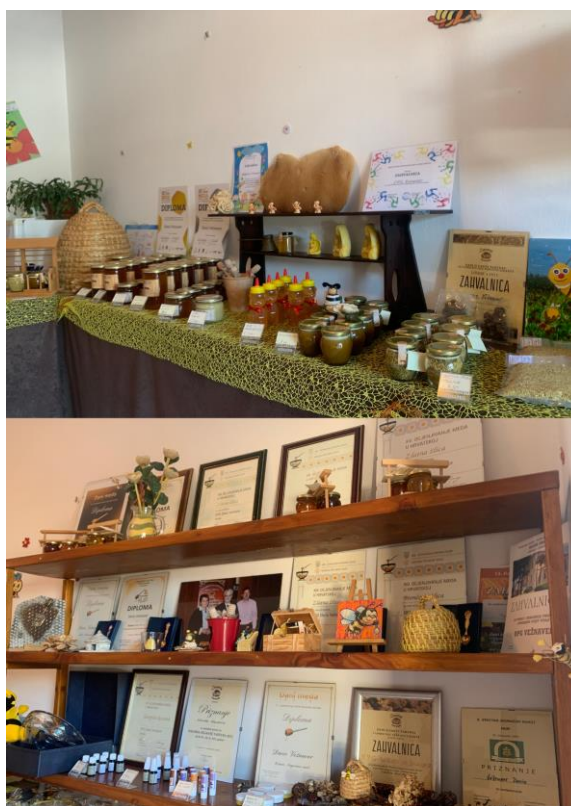
Slika 2: proizvodi, zahvalnice i diplome Pčelarstva Vežnaver

Kroz godine, kako im je poslovanje raslo, obitelj Vežnaver odlučila se svoje proizvode predstaviti na raznovrsnim sajmovima i mjesnim događajima. Primjer takvog sajma je Dani meda u Pazinu, koji se u 2024. godini održao u veljači. Tu manifestaciju već gotovo dvadeset godina provodi Udruga pčelara “Lipa” iz Pazina, te osim navedene manifestacije organiziraju stručna predavanja o pčelarstvu te stručne izlete po Hrvatskoj ili inozemstvu, kako bi svojim članovima proširili znanje o pčelarstvu. Manifestacija Dani meda obično traje dva dana preko vikenda, a program se sastoji od kušanja i dodjele nagrada za najbolje proizvode od meda, a sljedeći dan se provode predavanja o pčelarstvu. 54 U ovoj manifestaciji Pčelarstvo Vežnaver sudjeluje dugi niz godina, a nerijetko osvoje i nagradu za najbolji med.