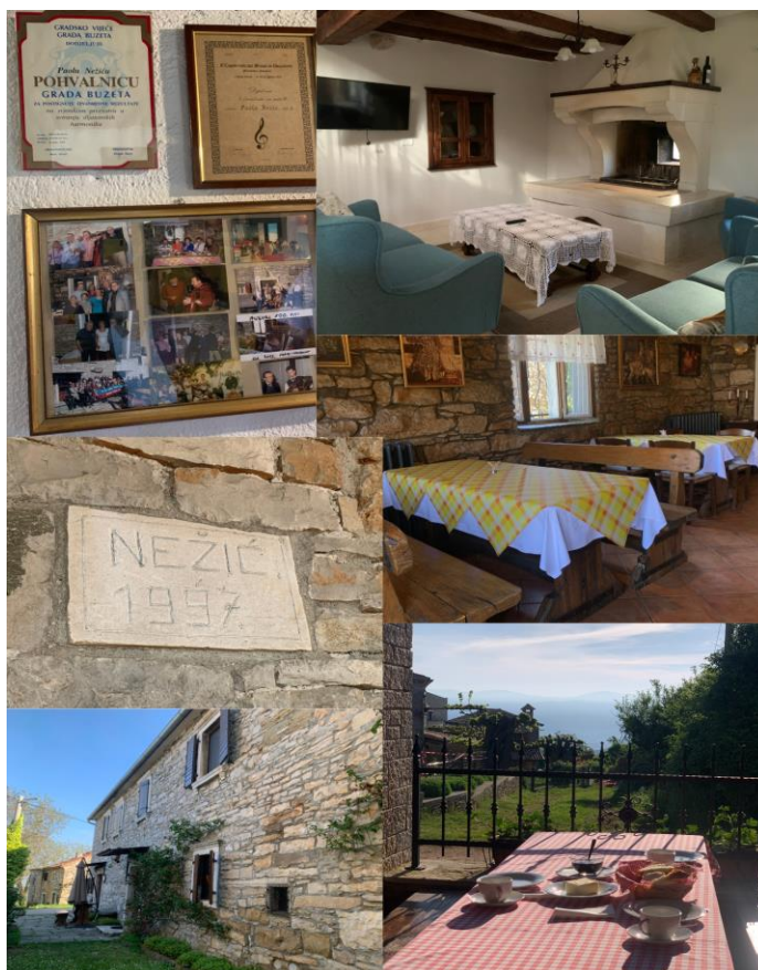
Slika 1: Agroturizam Nežić