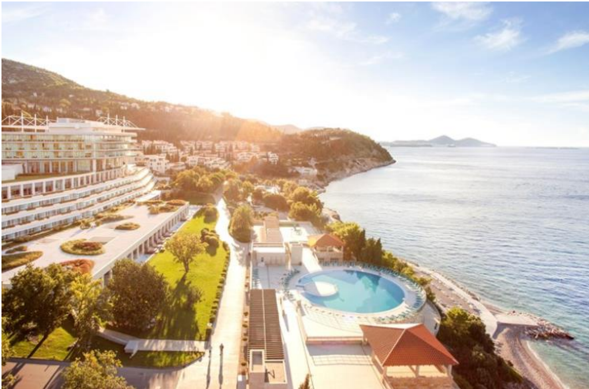
Slika 2. Hotel Sun Garden - Dubrovnik