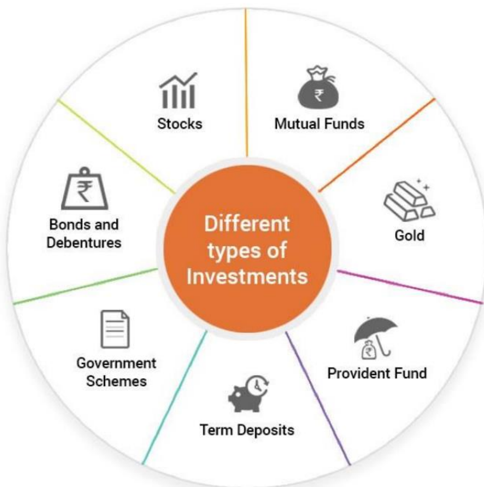
Slika 1. Vrste investicija u hotelijerstvo