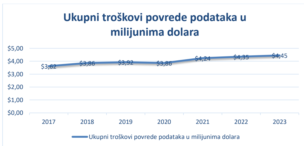
Grafikon 1. Ukupni troškovi povrede podataka u milijunima dolara

Uslijed mnogim povredama podataka koji se odvijaju u hotelskoj industriji, Trustwave je kompanija koja svake godine objavljuje izvještaj pod imenom : „Hospitality Sector Threat Landscape“ koja istražuje specifične prijetnje i rizike za ugostiteljske i hotelske organizacije, te nudi praktične uvide i savjete kako ojačati obranu od kibernetičkih upada. IBM također svake godine izrađuje izvještaj nazvan „Data breach report“ u kojem iznose ukupne troškove povrede podataka te sve vrste proboja, putem kojeg se može dobiti uvid u troškove povreda podataka te statistiku povreda podataka u kompanijama.