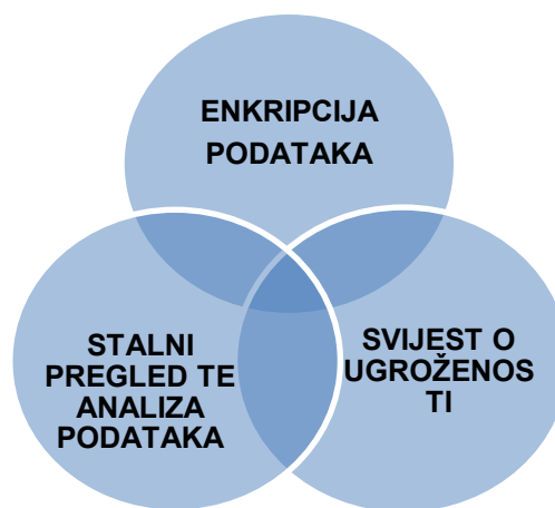
Slika 2. Najvažniji elementi zaštite podataka

Postoje mnoge strategije koje hotelska organizacija može iskoristiti kako bi se obranila od povrede podataka ali najvažniji elementi su : enkripcija podataka, stalna analiza te ažurnost te svijest o ugroženosti podataka (slika 2.). Zaštita podataka mora biti prioritet u hotelskoj organizaciji posebice jer vrlo veliki broj gostiju dnevno prođe kroz hotel te ostavi svoje informacije o plaćanju i sl.