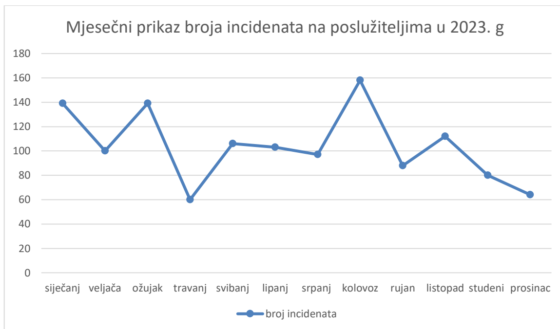
Grafikon 3. Mjesečni prikaz broja incidenata na poslužiteljima u 2023. godini

dolaze. Također sve je češći pojam poslovne prijevare koje se također mogu odvijati u hotelijerstvu sa dobavljačima i klijentima.