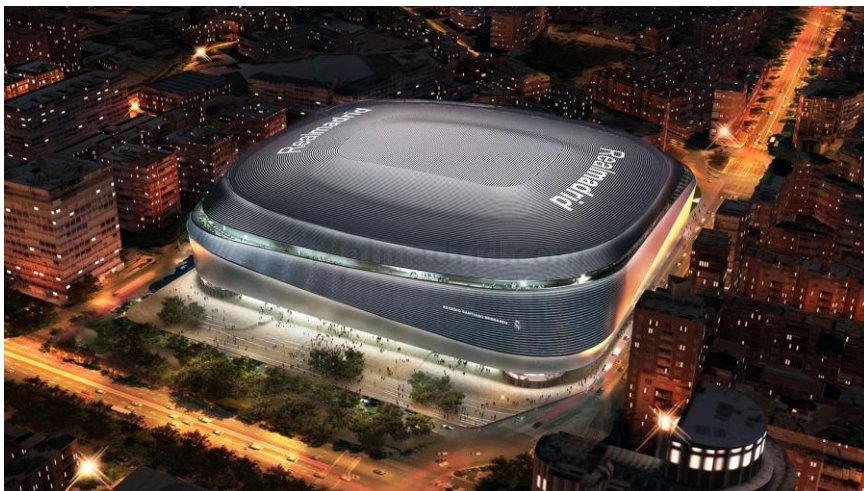
Slika 2. Stadion Santiago Bernabéu