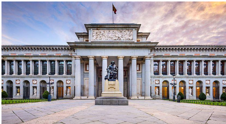
Slika 1. Muzej Prado