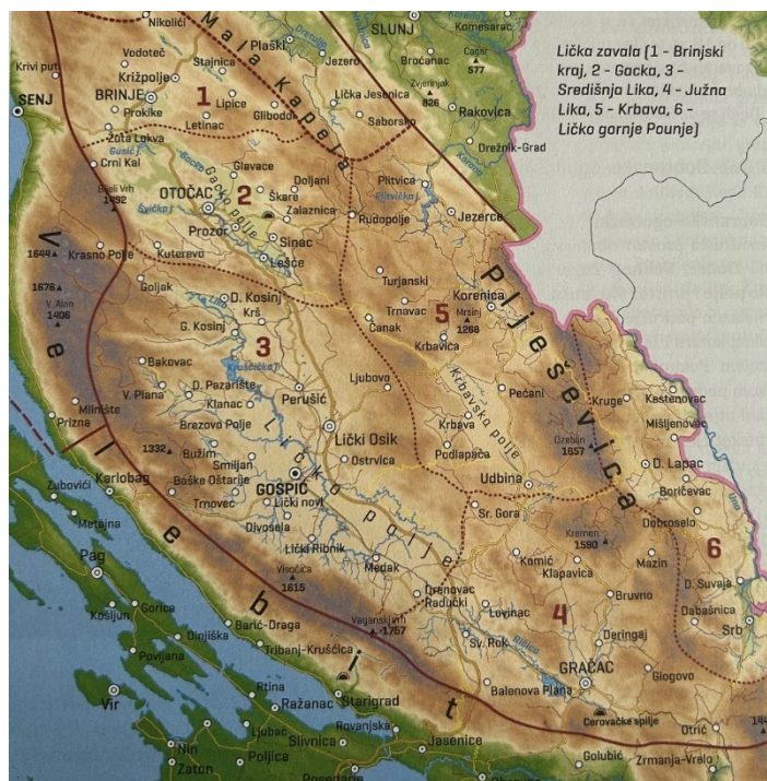
Slika 2. Geografska karta Like