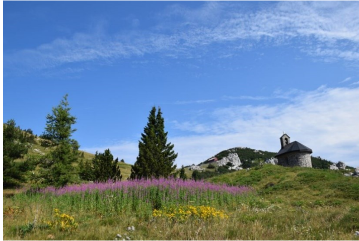
Slika 3. NP Sjeverni Velebit, Zavižan