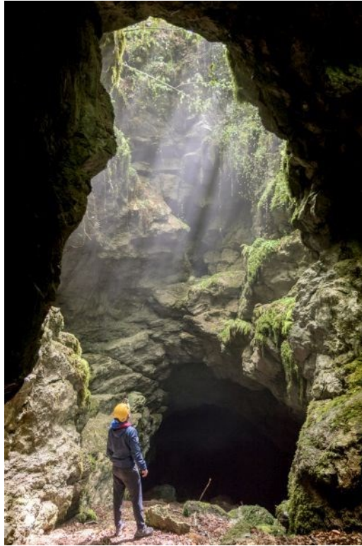
Slika 4. Pećinski park Grabovača