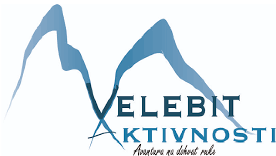
Slika 5. Logo poduzeća

Obiteljsko poduzetništvo u turizmu je ključni pokretač gospodarskog razvoja i inovacija u mnogim regijama pa tako i u Lici. Obiteljska poduzeća često su duboko ukorijenjena u svojim lokalnim zajednicama, pružajući autentične i jedinstvene turističke doživljaje koji odražavaju lokalnu kulturu i nasljeđe. U nastavku rada analizira se kako obiteljsko poduzetništvo može uspjeti u turističkom sektoru kroz primjer poduzeća “Velebit aktivnosti j.d.o.o.”.