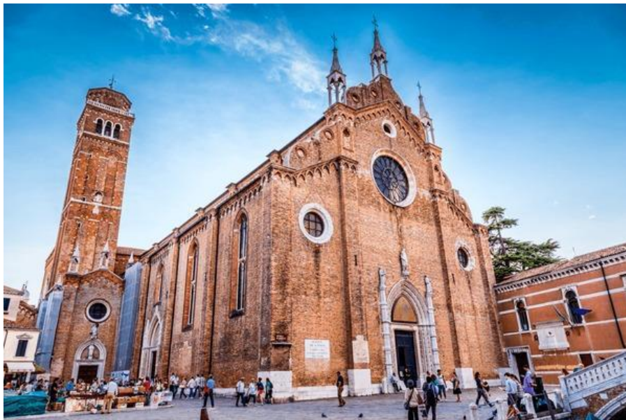
Slika 7: Crkva Santa Maria Gloriosa dei Frari (preuzeto 15.lipnja 2024.)

Nakon propasti Republike, samostan i dvorišta crkve postali su dom Državnog arhiva. Tako je oko 300 prostorija i 70 kilometara polica ispunjeno neprocjenjivim zapisima o povijesti Venecije iz 9.stoljeća, što uključuje i Zlatnu knjigu venecijanske aristokracije.