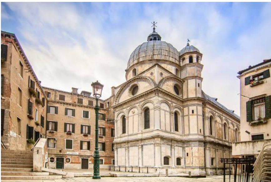
Slika 8: Crkva Santa Maria dei Miracoli (preuzeto 15.lipnja 2024.)

Crkva Santa Maria dei Miracoli jedna je od omiljenih za vjenčanja i djelo Pietra Lombardija. U njoj je smještena značajna ikona Svete Marije od Čudesas, po kojoj je i imenovana. Ovo je zdanje jedno od najboljih primjera renesansne venecijanske arhitekture. Ipak, bila je primorana na obnove zbog utjecaja vlage, što je neuobičajeno za renesansna zdanja budući da su se zidovi od opeke oblagali mramornim pločama, no između ploča i zidova je ostavljena šupljina za protok zraka. 46