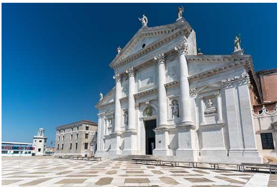
Slika 10: Crkva San Giorgio Maggiore (preuzeto 15.lipnja 2024.)