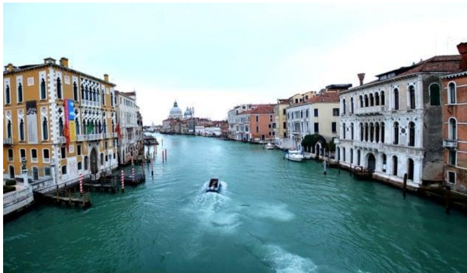
Slika 5: Kanal Grande (preuzeto 15.lipnja 2024.)

Osim ove uobičajene plovidbe za upoznavanje Venecije, te spomenute Regate Storice, Canal Grande mjesto je i svetkovine Madonna della Salute, koja se održava 21.studenog, te se posjećuje crkva Santa Maria della Salute, uz hodočašće preko lanala na privremenom pontonskom mostu. 40