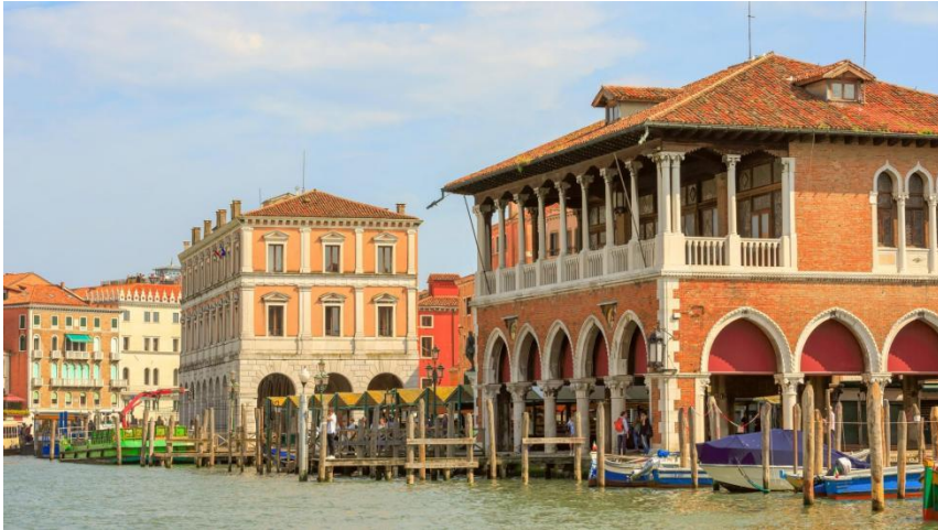
Slika 6: Tržnica Rialto (preuzeto 15.lipnja 2024.)

Uski prolazi ove tržnice nose nazive poput Orefici (zlatari), Pescaria (ribarnica) i Erberia (tržnica povrćem) jer su nekoć istovrsne trgovine bile okupljene na jednom mjestu, a zalagajnice za trgovce također su imale slikovite nazive poput Scimmia (majmun) i Do Mori (Dva Maura). 43