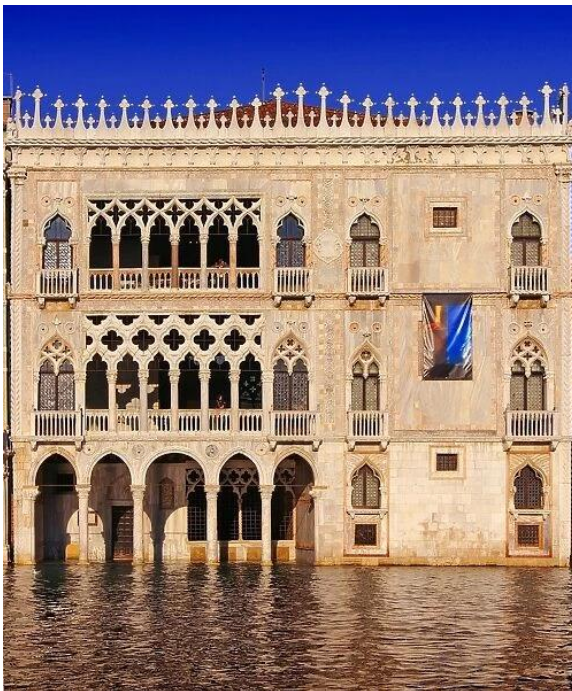
Slika 14: Ca' d'Oro (preuzeto 15.lipnja 2024.) Slika br.13.: Ca' d'Oro (preuzeto 15.lipnja 2024.)

duždeva, a trajala je desetak godina. Palača je djelo klesara iz 15.stoljeća, a projektanti zdanja jesu Giovanni i Bartolomeo Bon, zaslužni za izgradnju i same Duždeve palače. Ova venecijansko gotička palača sagrađena je oko manjeg unutarnjeg dvorišta, kao i mnoštvo takvih u Veneciji. Nakon izmjene nekoliko privatnih vlasnika, zadnje je vlasništvo palo u ruke baruna Giorgija Franchettija, koji je palači darovao bogatu kolekciju umjetnina koje su danas izložene u Galeriji Franchetti unutar palače te posjetiteljima nude uvid u djela slavni talijanskih umjetnika ili autora iz flamanske škole, ali i u razne skulpture i keramičke predmete. 53