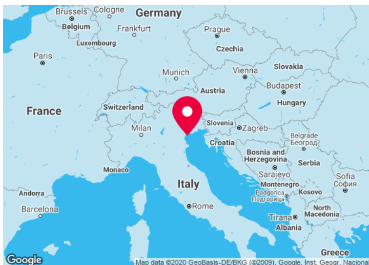
Slika 1.: Položaj grada Venecije (preuzeto 22.kolovoza 2024.)

Lidom i Mestru na sjeverozapadnoj obali, a gradska jezgra se rasprostire na gusto zbijenoj otočnoj skupini od 118 otočića međusobno odvojenim kanalima i spojenim mostovima. 5 Budući da su otočići glinene građe, nužnost je izgradnje Venecije na temeljima od drvenih balvana, dugima devet metara, zabijenima u mekano tlo. 6 Neizbježno je i u posljednjim desetljećima jako uočljivo postupno tonjenje grada što predstavlja glavni problem gradskih nadležnih tijela. 7