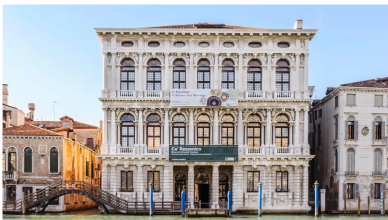
Slika 18: Ca' Rezzonico (preuzeto 15.lipnja 2024.)

Izvor: https://venezianews.it/artnightvenezia-2022/ca-rezzonico-museo-del-settecento-veneziano/