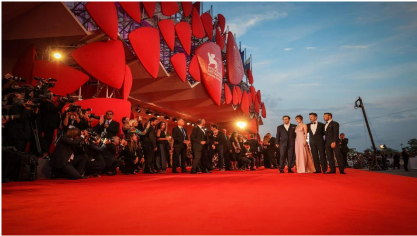
Slika 21: Venecijanski filmski festival (preuzeto 15.lipnja 2024.)

poznata imena u Veneciju, što automatski povlači dodatnu privlačnu snagu za još posjetitelja željnih kontakta sa slavnim osobama. 63