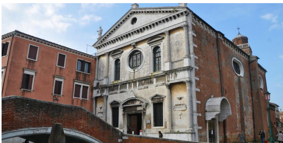
Slika 11: Crkva San Sebastiano (preuzeto 15.lipnja 2024.)

Crkva San Sebastiano remek-djelo je iz 16.stoljeća čiji je strop, zidove, krila orgulja i oltar godinama ukrašavao Paolo Veronese, a krasi ju i djela Tintoretta i Tiziana. Sam Veronese pokopan je među svojim remek-djelima koja se trenutno obnavljaju. Crkva je podignuta kao zahvala nakon završetka epidemije kuge i nosi ime sveca kojeg se asocira s bolešću. 49