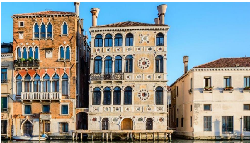
Slika 17: Ca' Dario (preuzeto 15.lipnja 2024.)