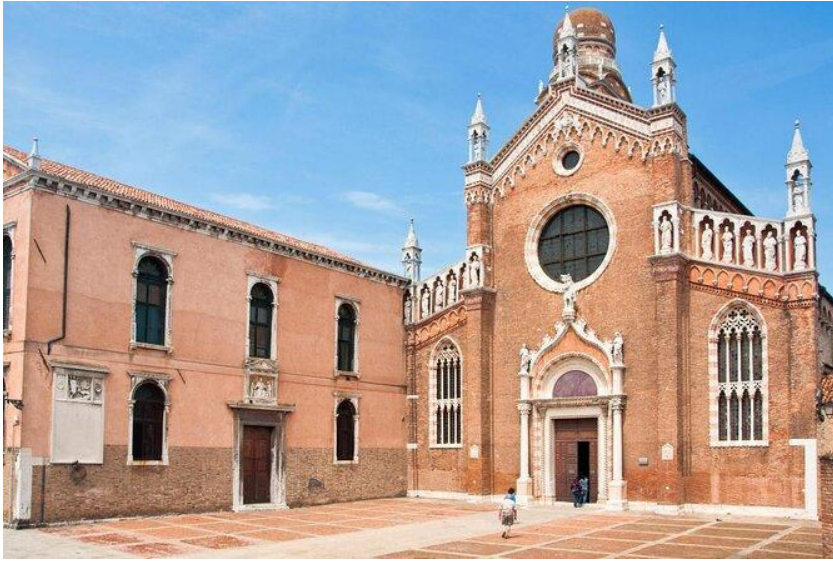
Slika 12: Crkva Madonna dell'Orto (preuzeto 15.lipnja 2024.)

Crkva Madonne dell'Orto bila je rodna župa Tintoretta i stoga obiluje nizom njegovih djela, ali i njegovom grobnicom. Podignuta je sredinom 14.stoljeća po naredbi Tiberija da Parme, koji je ondje i pokopan. Visoki oltar crkve okružuju dva remek-djela iz 1546.godine- dramatični "Posljednji sud" i starozavjetni prizor "Štovanje zlatnog teleta". Tintoretto je pokopan u apsidnoj kapelici na desnoj strani crkve, zajedno sa svoje dvoje djece. 50