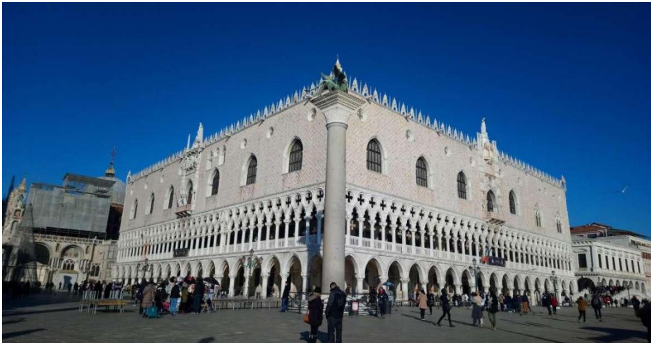
Slika 3: Duždeva palača (preuzeto 15.lipnja 2024.)