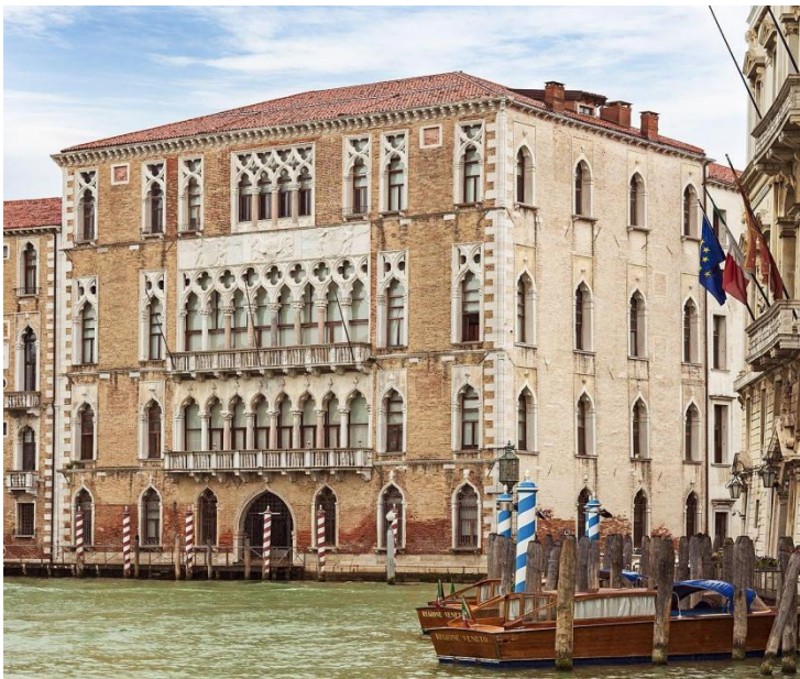
Slika 15: Ca' Foscari (preuzeto 15.lipnja 2024.)

dužd Francesco Foscari kako bi pronašao dom svojoj obitelji, te ruši postojeću palaču, s željom ponovnog početka i zatiranja svakog traga prijašnjih vlasnika. I ovu palaču grade Giovanni i Bartolomeo Bon, i to kroz nekoliko godina tako da se novi vlasnik uspio useliti tik pred svoju smrt. Palača je služila kao rezidencija za važne goste poput europskih vladara i diplomata, ali i, zahvaljujući svom izvrsnom položaju koji nudi spektakularan pogled, i omiljeno mjesto brojnih slikara za slikanje Canala Grande. Kasnije je upotrebljavana kao bolnica, zatim vojarna austrijske vojske, a naposljetku kao Viša škola za trgovinu iz koje kasnije postaje fakultet te je palača i danas dio Venecijanskog sveučilišta. 54