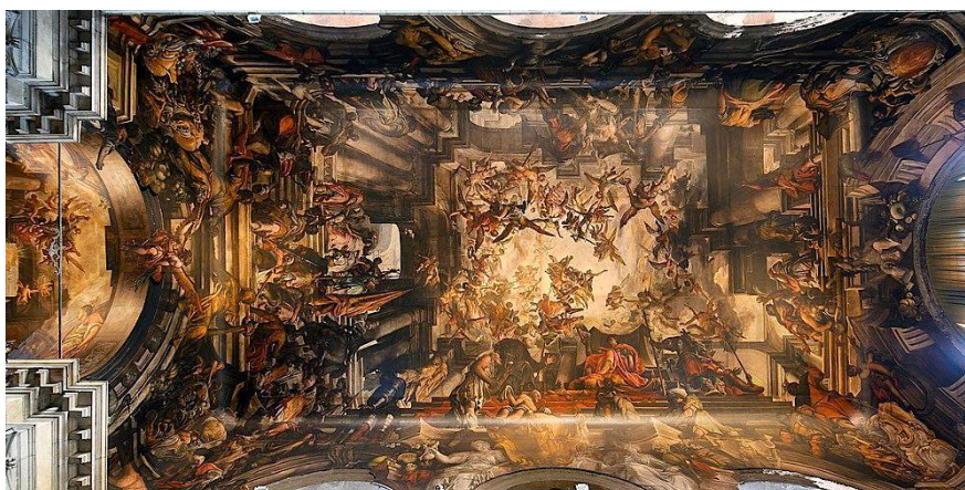
Slika 13: Strop crkve San Pantalon (preuzeto 15.lipnja 2024.)