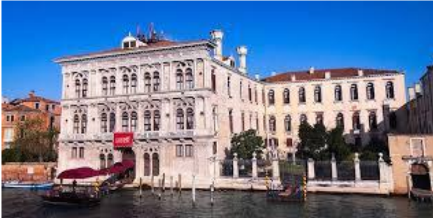
Slika 16: Palazzo Vendramin-Calergi (preuzeto 15.lipnja 2024.)

desnoj strani dvorišta te tako dobiva oblik slova L, no to je zdanje ubrzo srušeno. Od 1739. godine palača zapada pod vlasništvo obitelji Vendramin-Calergi, koja u nju dolazi ženidbom i obitava ondje jedan vijek. Danas je palača u vlasništvu grada Venecija te je ondje smješten Venecijanski kazino, a zimi i Muzej Wagner. 56