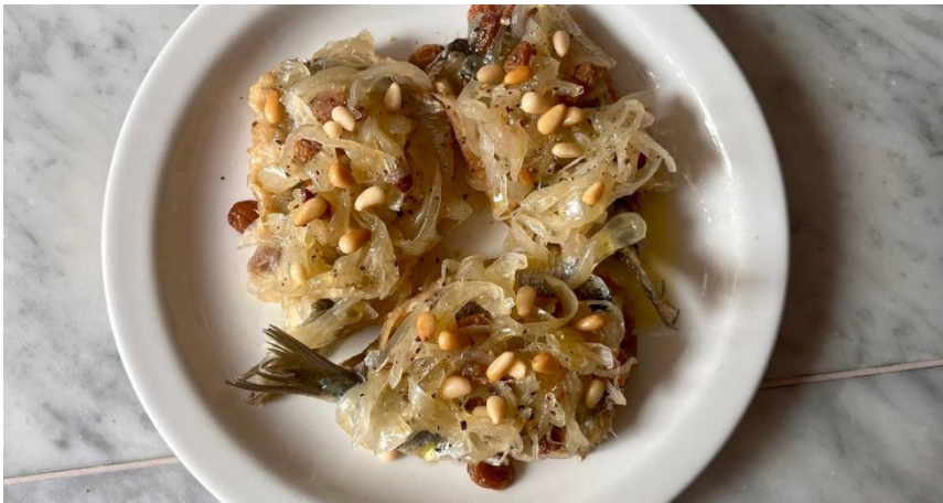
Slika 22: Sardine in Saor (preuzeto 15.lipnja 2024.)

u ponudi je širok izbor svježih voćnih sokova, nerijetko cijedenih na licu mjesta, a svakako se ne smije zaboraviti kava kao sastavni dio talijanskog života. 64 Restorani u samom srcu Venecije, na Trgu svetog Marka, poslužuju pretežno talijansku hranu iz regije, s naglaskom na ribi, gdje se ručak obično poslužuje oko 12:30, a večera od 20 sati na dalje. Neki od takvih jesu: Al Conte Pescaor, Da Arturo, Al Graspò de Ua, Antico Martini, La Caravella, Do Forni, Grand Canal i brojni drugi. 65