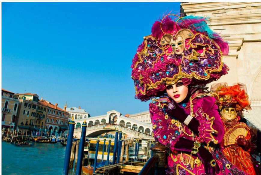
Slika 20: Venecijanski karneval (preuzeto 15.lipnja 2024.)

Izvor: https://kuna.hr/putovanja/karneval-u-veneciji-iz-osijeka-2/