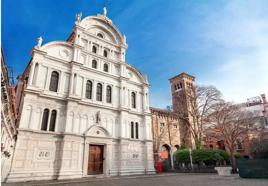
Slika 9: Crkva San Zaccaria (preuzeto 15.lipnja 2024.)

U samostanu svetog Zaharije, koji danas služi kao policijska postaja, najbogatiji su Mlečani smještali svoje kćeri, a ondje su se održavale i lutkarske predstave, iako i dalje kruže priče o ondašnjem razuzdanom životu. 47