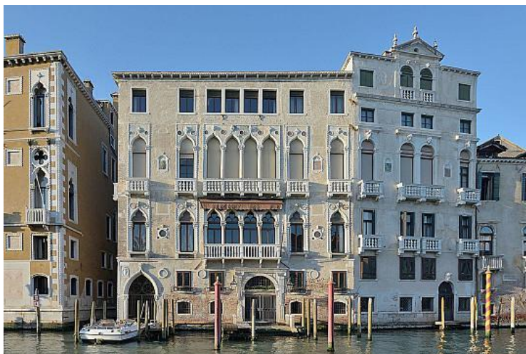
Slika 19: Palazzi Barbaro (preuzeto 15.lipnja 2024.)