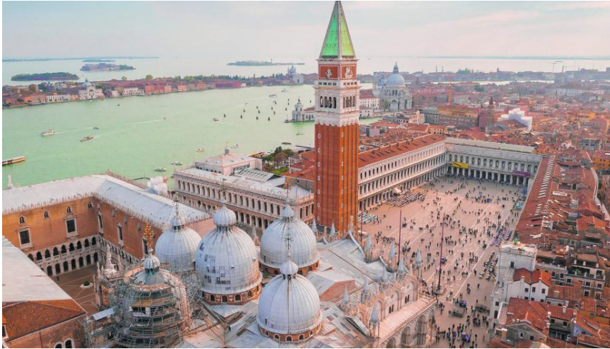
Slika 4: Trg svetog Marka (preuzeto 15.lipnja 2024.)

Iza Novih Prokurativa nalaze se Giardinetti Reali ili Kraljevski vrtovi, uređeni početkom 19.stoljeća.