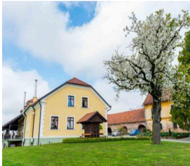
Slika 2. Restoran Terbotz