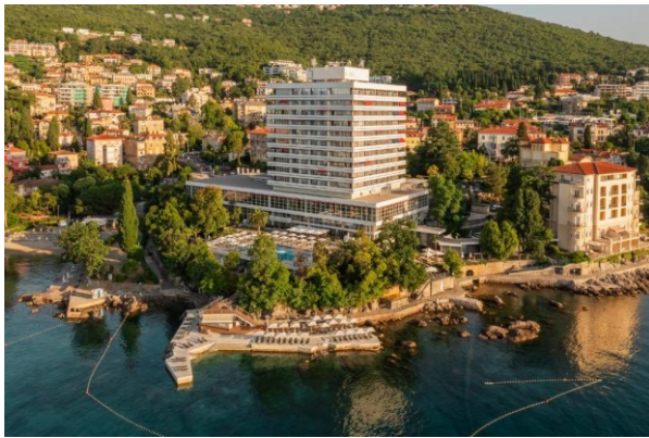
Slika 9: Hotel Ambassador

korišten za izgradnju stambenih zgrada kako bi se pozitivno utjecalo na smanjenje iseljavanja stanovništva. Apartmanizacija je posljedica turističkog razvoja svake lokacije, i očekivano je da se dogodila i u Opatiji. Takva izgradnja bi bila prihvatljiva da se zadrži na perifernim dijelovima grada iznad Nove cesta, ali polako se i približava centru Opatije. Na Slatini, koja spada pod centar Opatije, 2024. je dovršena izgradnja novog Keight hotel Opatija koji se znatno ističe sa svojim modernim dizajnom od ostalih austrougarskih vila oko njega i s time narušuje povijesnu atmosferu grada. I važi još spomenuti Hotel Ambassador koji, prema da je sagrađen oko 1950. godine kada takve teme još nisu bile prestrogo gledane, sa svojom veličinom i kockastim čisto bijelim dizajnom dominira Opatijski pejzaž sa izgledom koji ne uklapa s ostatkom Opatije.