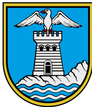
Slika 3. Grb grada Opatije

Geografski položaj Opatije pruža jedinstvenu kombinaciju planinskog i morskog pejzaža, smještena između padina planine Učke i Jadranskog mora. Grad Opatija se sastoji od nekoliko naselja, a to su: Opatija, Dobreć, Ičići, Ika, Mala Učka, Oprič, Pobri, Poljane, Vela Učka i Veprinac, no u ovom radu će se primarno fokusirati na naselje Opatija. Ono obuhvaća površinu od 67,2 km i prema zadnjem popisu stanovništva 2021. u njemu živi 10619 stanovnika (kojih je 5701 konkretno u naselju Opatija). Opatija uživa u ugodnoj mediteranskoj klimi s blagim zimama i sunčanim ljetom. Prema odluci o razvrstavanju jedinica lokalne i područne samouprave prema stupnju razvijenosti, Grad Opatija spada u najvišu VIII. skupinu što znači da se nalazi u 25 % najrazvijenijih jedinica u Republici Hrvatskoj.