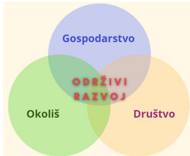
Slika 1. Stupovi održivog razvoja