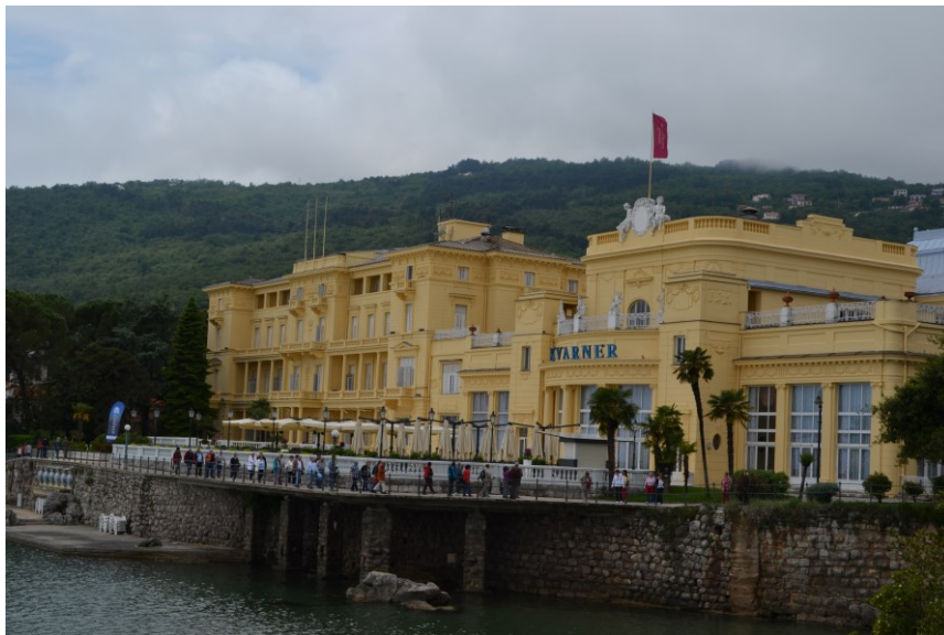
Slika 7. Hotel Kvarner

Hotel Kvarner je najstariji hotel na Jadranu, a u svojoj bogatoj povijesti udomio je brojne povijesne ličnosti kao što su Franjo Josip I., Franz Ferdinand, Anton Pavlovič Čehov te mnogi drugi. Hotel radi i danas, a najviše se ističe po elegantnoj Kristalnoj dvorani, koja je najveći takav prostor u Opatiji s kapacitetom od 950 ljudi i direktnim pristupom na primorsku terasu hotela.