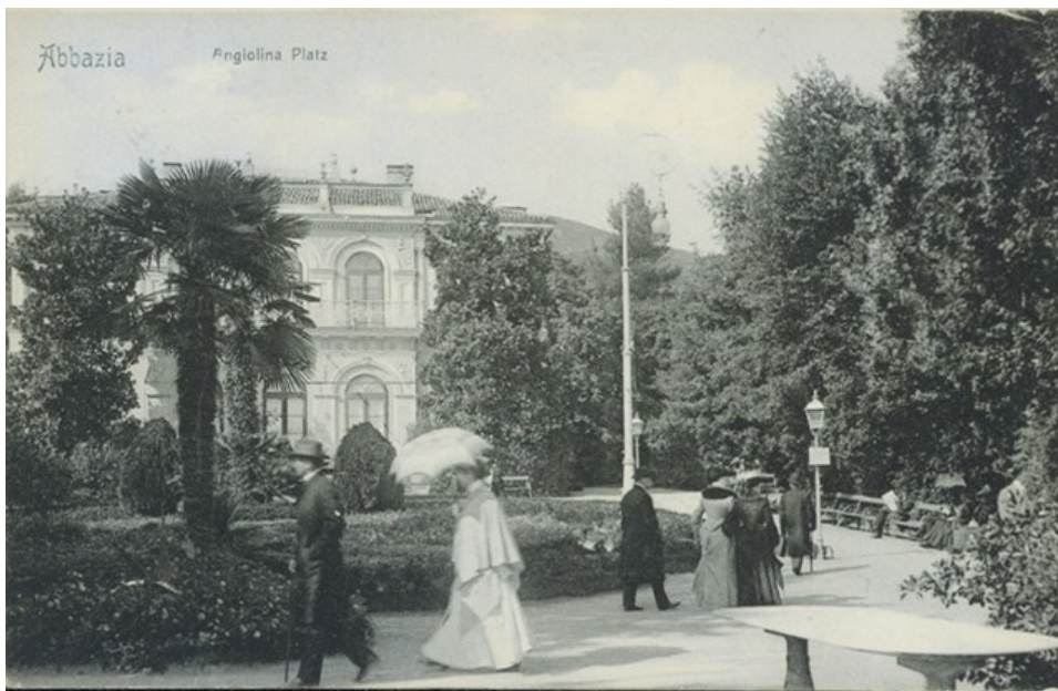
Slika 4. Villa Angiolina

Opatija se tijekom stoljeća razvila u malo selo od svega 120 kuća i bila je orijentirana pomorstvu i ribarstvu. Ali to se sve promijenilo s dovršavanjem obalne ceste Rijeka-Volosko-Opatija što je značilo da se do Opatije nije više moralo ići preko Kastva i Matulja, znatno poboljšavši prometnu povezanost grada. Čovjek zaslužan za gradnju ove ceste je bio Iginio Scarpa koji je također 1844. godine u Opatiji otkupio teren od lokalnog pomorca na kojem je dao izgraditi prvu opatijsku vilu „Villu Angiolinu“ (nazvana po njegovoj preminuloj ženi). U tu raskošnu vilu je pozivao mnoge imućne i ugledne goste, najznatniji od kojih su bili Josip ban Jelačić i austrijska carica Marija Ana, čiji dolazak je znatno ojačao popularnost Opatije.