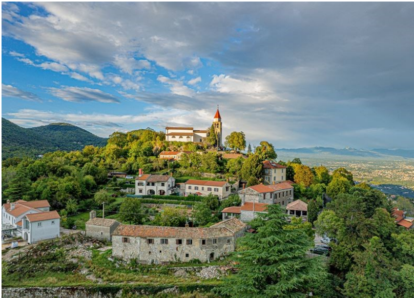
Slika 8 Veprinac

uvažiti mišljenje lokalnog stanovništva koje zbog prirode manjih naselja i njihove zajednice možda ne bi bili receptivni prema turističkom razvoju. Ruralna područja Opatije ostaju jedan od njezinih najvećih potencijala, ali s jednako velikim rizikom razvoja.