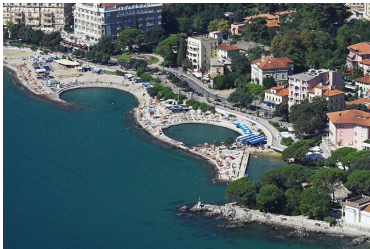
Slika 6. Plaža Slatina

Osim predstavljenih šetališta, Opatija ima i veliku ponudu kupališta. Veća kupališta razlikuju se jedno od drugog s obzirom na uslugu koju nude te ciljanoj populaciji; Tomaševac je sa svojim igralištem i restoranom „Del mare“ prilagođen obiteljima s manjom djecom, Slatina i Ičići su velike betonsko-pješčane plaže s brojnim sportskim sadržajima, restoranima i kafićima, Lido s „Bevanda beach resort“ te hotelske plaže Royal i Savoy nude otmjeniju uslugu za goste s većim financijskim mogućnostima, a u ponudi je cijeli niz manjih kupališta kao što su Ika, Črnikovica, Škrbići te plaža za pse na Punta Colovi. Zbog svojih početka, kada se Opatija brendirala kao turistička destinacija za imućnije, Opatija je prepuna malih bezimernih plaža građenih kao privatni izlaz na more primorskih vila koji su u međuvremenu postali javno dobro zbog modernih zakona o pomorskom dobru, što ljudima pruža veliki broj manjih i mirnijih plaža.