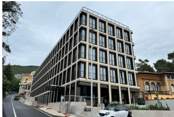
Slika 10: Hotel Keight Opatija