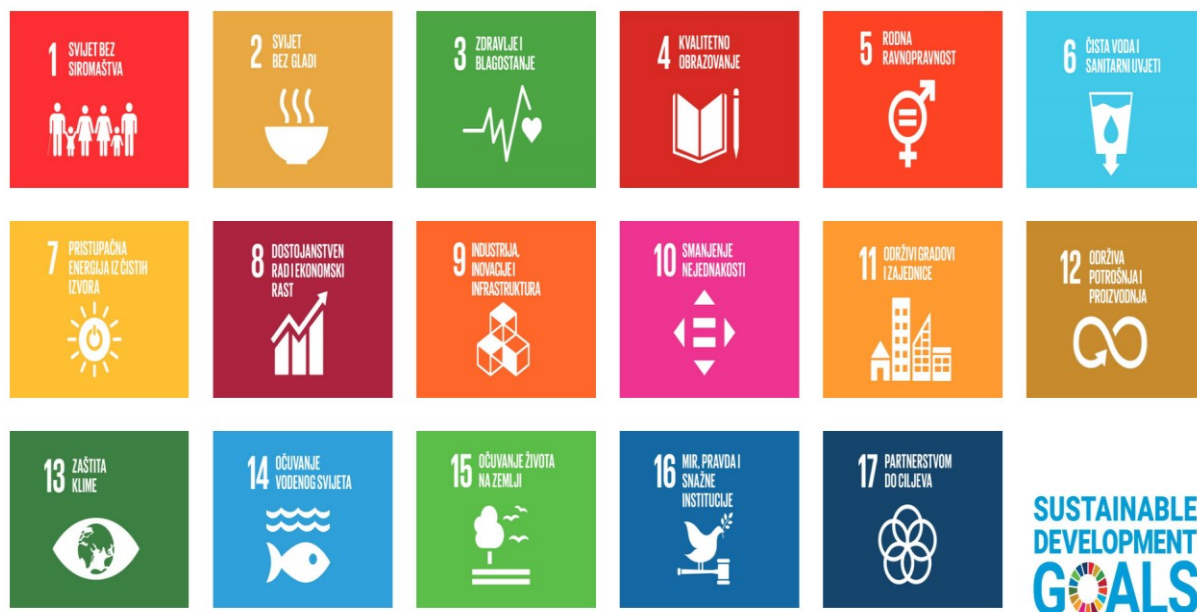
Slika 2. Ciljevi održivog razvoja

Važan dokument kojim je definiran održivi razvoj nastao je 1992. godine na Drugoj konferenciji Ujedinjenih naroda u Rio de Janeiru kada je donesen akcijski plan „Agenda 21“ koja je definirala 17 ciljeva za daljnji održivi razvoj. Ti ciljevi detaljnije su dorađeni u „Agendi 30“ koje je objavljena na konferenciji u New Yorku 2015. godine te glase: