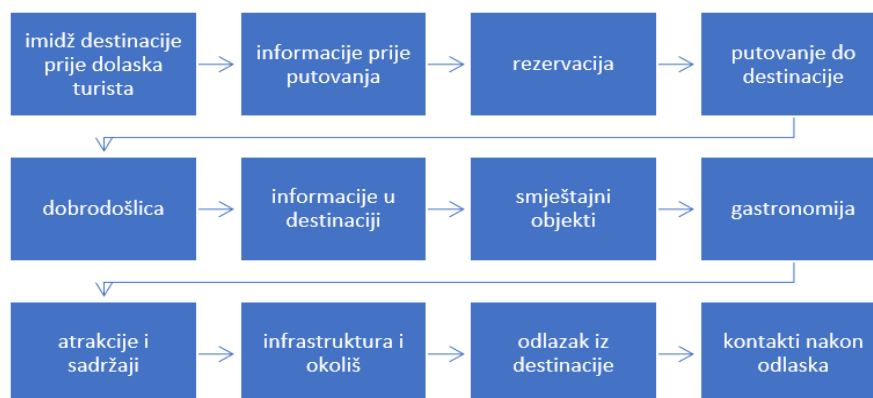
Slika 3. Lanac vrijednosti u turizmu

Izvor: Vrtođušić Hrgović, A., Jeličić, A., D., Mjerenje i ocjenjivanje kvalitete turističke destinacije-QUALITEST, 20. Međunarodni simpozij o kvaliteti: „Kvaliteta – jučer, danas, sutra“, 2019., str. 333-340,