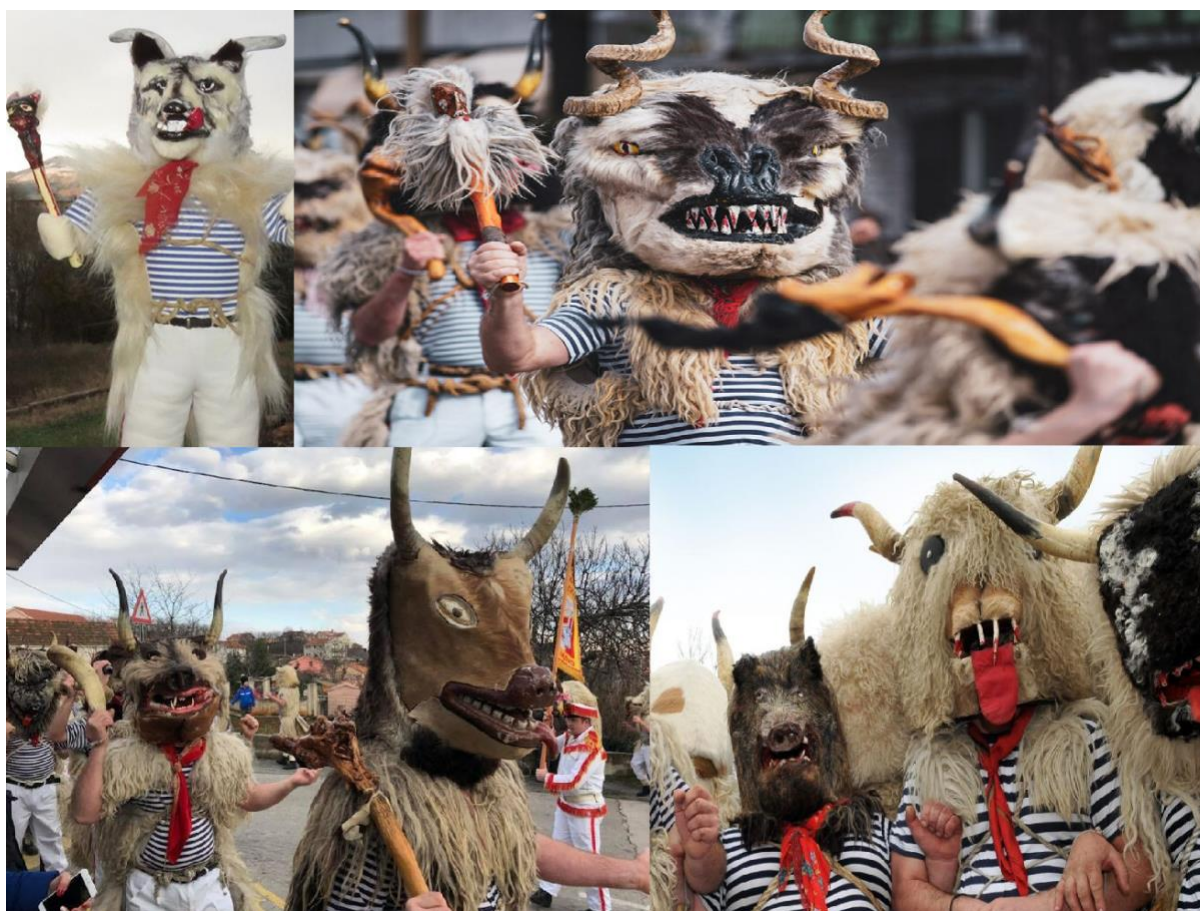
Photographie n° 6 : Masques des sonneurs de cloches Halubaj