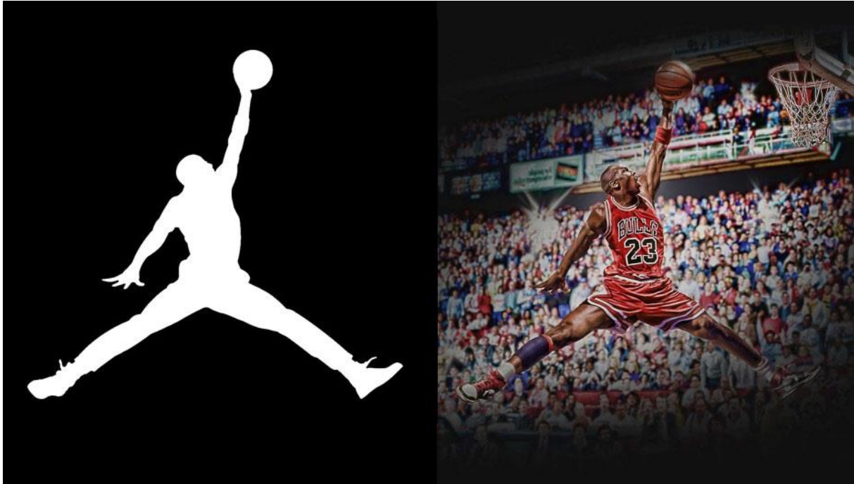
Slika 7 Logo Nike Air Jordan linije napravljen prema skoku Michaela Jordana

Aviation American Gin je brend koji sebe ne shvaća previše ozbiljno. A tko bi bolje utjelovio taj osjećaj od Ryana Reynoldsa, glumca čije su se komedije dobro udomaćile u svemu, od Van Wildera do Deadpoola. Reynolds tipizira sve karakteristike koje brend želi predstaviti: zabavno, opušteno, malo drugačije i dobar provod. Ali iza šale, riječ je o kvalitetnom proizvodu, koji je zaslužio najveću ocjenu ikada (za gin) od časopisa Wine Enthusiast. Poput samog Reynoldsa, koji je možda pomalo šaljivdžija, ali je jedan od glumaca s najvećom zaradom svih vremena. Iako je Aviation American Gin kvalitetan, to nije ono što ovoj podršci slavni daje dodatnu prednost. Činjenica je da Reynolds posjeduje udio u robnoj marki - on je u igri, što pokazuje da je više nego voljan uložiti svoj novac u ono što promovira kada je u pitanju ovaj proizvod. Reynolds je snimio više šaljivih oglasa gdje promovira ovaj gin. Postoji li bolji način za promociju brenda od toga? Čak i ako je, kao što Reynolds ističe u jednom od svojih šaljivih oglasa, Aviation American Gin sada tehnički “u vlasništvu Kanađanina” (UneeQBlog, 2023).