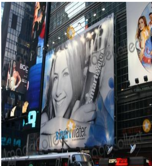
Slika 1 Jennifer Aniston - Smart Water plakat

Poduzeća također postavljaju plakate kako bi privukli pažnju na svoje proizvode. Plakati su ograničeni na minimalno teksta, što često uključuje logo, slogan i naziv marke. Kako bi se istaknuli u masi, nerijetko koriste slavne osobe.