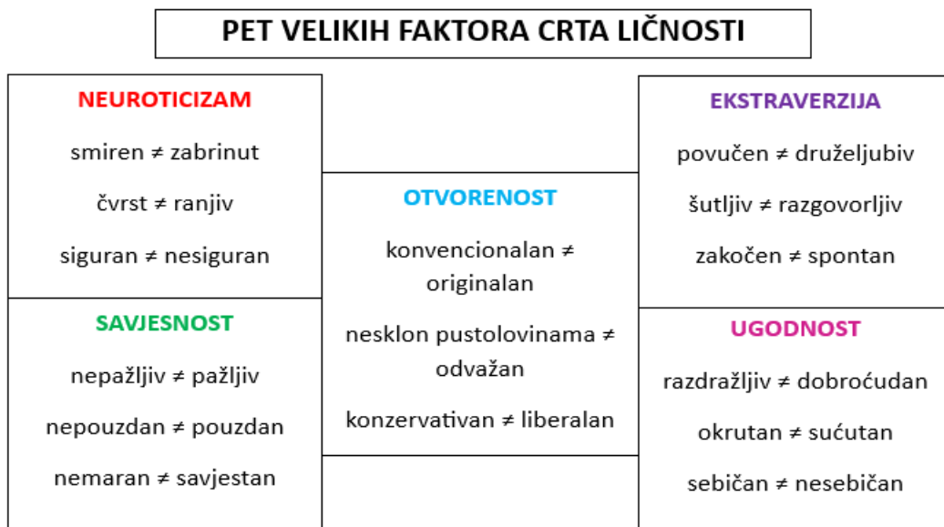
Shema 1 The Big Five model ličnosti