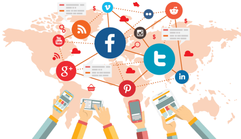
Slika 1. Ilustracija koja pokazuje kako društveni mediji ujedanjuju korisnike preko interneta

Tvrtke i ostali poslovni subjekti su oduvijek koristile razne načine marketinga da reklamiraju svoje ponude kako bi došli do potencijalnih korisnika i potražnje. Nekada su glavni subjekti u tome bile novine, časopisi, plakati i razni oglasnici. Nakon nekog vremena pojavili su se novi mediji poput radija i televizije koji su promijenili načine marketinga, a najveća promjena je nastala u ne tako davnoj prošlosti kad se pojavio internet koji je imao veliki utjecaj na cijeli svijet, a pogotovo pojavom društvenih medija koji su promijenili stil života i utjecali na razmišljanje ljudi širom svijeta. Društveni mediji su danas toliko korišteni da je prema statistici iz siječnja 2023. godine ukupan broj korisnika 4,76 milijardi, a to je 59,4% cijele svjetske populacije. Jedna od glavnih tema koje korisnici društvenih medija rado postavljaju na svoje profile su putovanja, pa se može reći da društveni mediji imaju jak utjecaj na turizam i ugostiteljstvo. Ovaj rad govori o tome kako društveni mediji utječu na ponašanje turista kao i na turističku potražnju. Prvi dio rada govori o povijesti društvenih medija, te o pet najpoznatijih društvenih mreža i o njihovoj povezanosti s turizmom. Drugi dio ovog rada su prijašnja istraživanja koja govore o utjecaju društvenih mreža na turističku potražnju poslovnih subjekata ili destinacije. Treći i posljednji dio ovog rada je istraživanje provedeno za ovaj rad u kojemu se istražuje koliko društvene mreže utječu na odabir putovanja ispitanika.