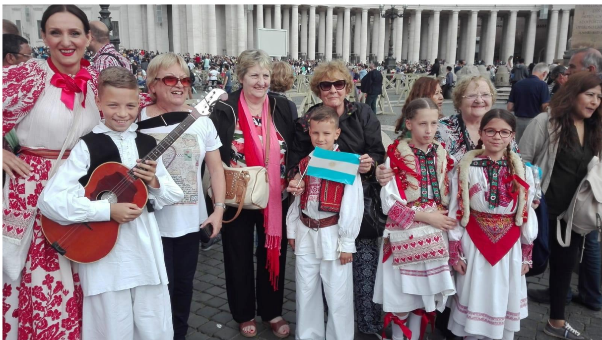
Slika 9. Folkloriši Udruge sa turistima iz Argentine u Vatikanu

U trideset godina svoga djelovanja, Udruga je osim u Hrvatskoj, ostvarila nastupe i u inozemstvu (BiH, Češka, Poljska, Makedonija, Italija, Bugarska...) te tako doprinijela očuvanju i širenju naše kulturne baštine i izvan granica Lijepe naše. U sklopu projekta “Prigorski drmeš u Vatikanu” dana 23. svibnja 2018., KUD je imao jedinstvenu priliku sudjelovati na audijenciji Pape Franje. Tako su, nakon audijencije, pred prepunim Trgom sv. Petra izvedene dvije koreografije izvorne za kraj iz kojeg Udruga dolazi. Članovima koji su izvodili plesove prigorskog drmeša i koreografiju Sesevetskog prigorja pridružila se i publika. Prikazano u slikama ispod.