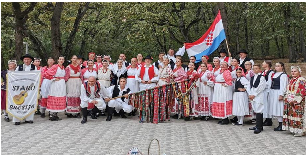
Slika 11. Udruga u nošnji Sesevetskog prigorja, Bugarska