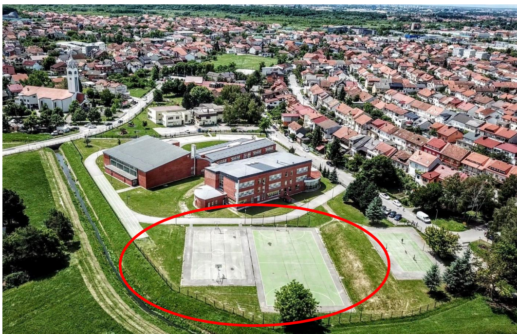
Slika 12. Igralište OŠ Brestje

Sama priredba sastoji se od sportskih natjecanja, eko sajma, radionica, zabavnog programa i onog najvažnijeg – folklornog dijela programa u kojem sudjeluju udruge iz cijele Hrvatske. Mjesto održavanja bilo bi veliko školsko igralište, prikazano na slici 12., koje bi osnovna škola ustupila za postavljanje velikog šatora, bine i razglasa.