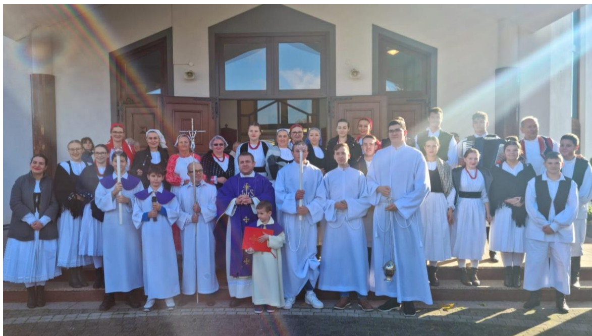
Slika 6. Udruga u nošnji Zagorja, paljenje 1.adventske svijeće (2022.g)

Može se pohvaliti sudjelovanjem i odličnim rezultatima na raznim nastupima i događajima. Redovito sudjeluje na Smotri folklornih amatera grada Zagreba i na događanjima kojima je organizator Grad Zagreb – Zavjetno hodočašće u Mariju Bistricu, Paljenje prve adventske svijeće (slika 6.), Advent u Zagrebu, Božić u Ciboni itd.