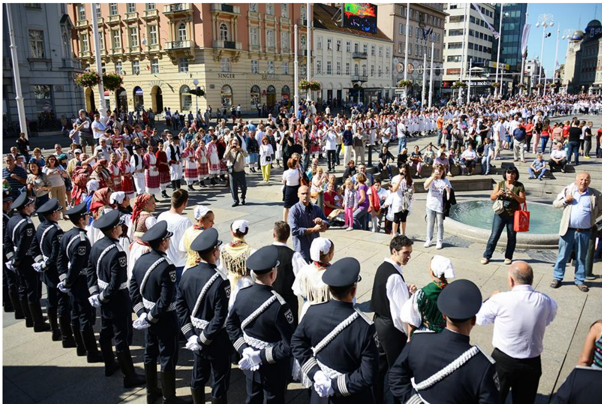
Slika 4. Najveće šokačko kolo u Zagrebu

godine u sklopu 49. Vinkovačkih jeseni kada su se kulturno-umjetnička društva Grada Zagreba, građani i turisti uključili u „Najveće šokačko kolo“.