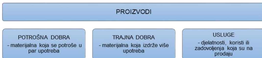
Slika 3. Osnovna klasifikacija proizvoda

Da su turistički proizvodi raznoliki vidimo iz osnovne klasifikacije proizvoda (slika 3.).