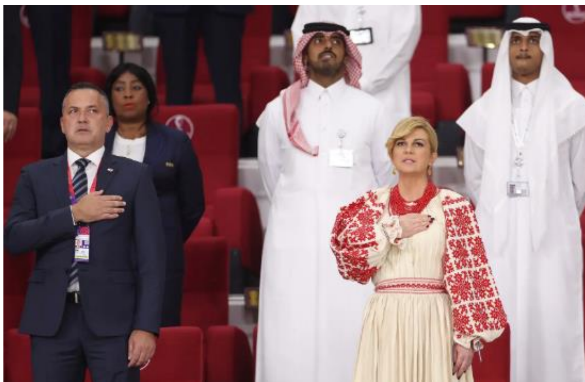
Slika 2. Kolinda Grabar Kitarović na Svjetskom nogometnom prvenstvu u Katru

Također, u obliku velikih sportskih ili vjerskih događaja mogu biti ključan činitelj imidža zemlje. U adventsko vrijeme često se mogu vidjeti pjevači/plesači kako u narodnim nošnjama izvode tradicionalne napjeve svojih krajeva. Nadalje, imalo se prilike vidjeti kako je veliku pažnju svijeta privukla sama posavska narodna nošnja koju je nosila bivša hrvatska predsjednica Kolinda Grabar Kitarović na Svjetskom prvenstvu u Katru.