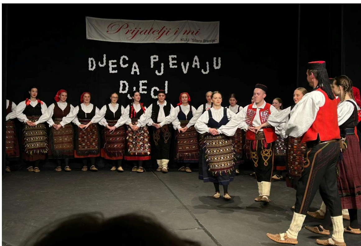
Slika 7. Udruga izvodi pjesme i plesove Like