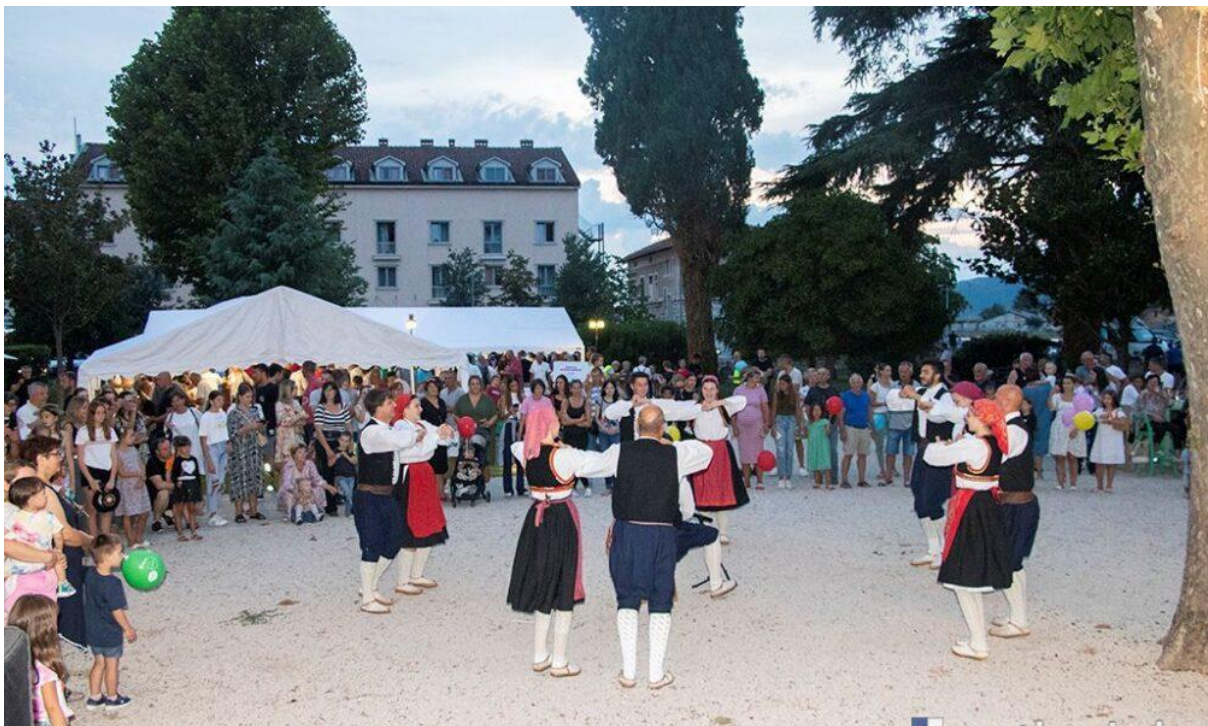
Slika 5. Festival tradicija, Metković