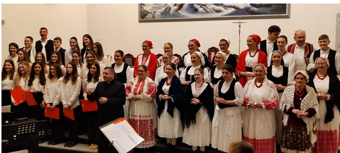
Slika 8. Koncert Udruge i župnog zbora mladih „Djeca Božja“ (2022.g)

Udruga sudjeluje u obilježavanju svih većih crkvenih i župnih blagdana naše Župe – Dan kruha i zahvala za plodove zemlje, Dan župe-blagdan Dobroga Pastira, Polnoćka (slika 8.) te na drugim svečanostima.