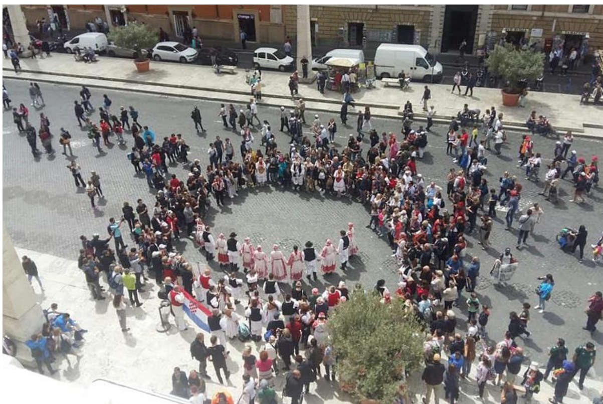
Slika 10. Nastup Udruge ispred Veleposlanstva RH u Vatikanu