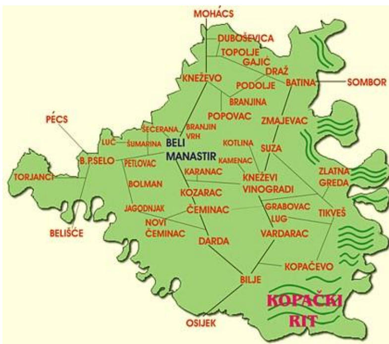
Slika 2. Karta Baranje, izvor: https://lag-baranja.hr/lag/item/1378-broj-stanovnika-baranjskih-mjesta-po-popisima-2021-2011-i-2001

Baranja je najistočnija regija Republike Hrvatske koja je povijesno i geografski oduvijek bila povezana sa susjednom Mađarskom. Beli Manastir jedini je baranjski grad i njeno administrativno središte. Uz njega Baranja obuhvaća osam općina navedenim od najnaseljenih prema onima s najmanje stanovnika: Darda, Bilje, Kneževi Vinogradi, Draž, Čeminac, Petlovac, Jagodnjak, Popovac i mnoga mala naselja, pustare i salaše.