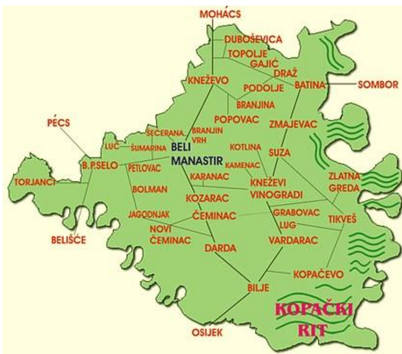
Slika 2. Karta Baranje, izvor: https://lag-baranja.hr/lag/item/1378-broj-stanovnika-baranjskih-mjesta-po-popisima-2021-2011-i-2001

Baranja je najistočnija regija Republike Hrvatske koja je povijesno i geografski oduvijek bila povezana sa susjednom Mađarskom. Beli Manastir jedini je baranjski grad i njeno administrativno središte. Uz njega Baranja obuhvaća osam općina navedenim od najnaseljenih prema onima s najmanje stanovnika: Darda, Bilje, Kneževi Vinogradi, Draž, Čeminac, Petlovac, Jagodnjak, Popovac i mnoga mala naselja, pustare i salaše.