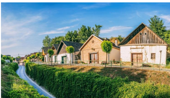
Slika 5. Vinska cesta u Zmajevcu

Od davnina kada su rimske legije prvi put zasijale vinograde u baranjskom području prema željama svojih careva, baranjsko vinogorje stvara bogata i jedinstvena vina posebnih osobina. Tijekom stoljeća znanja su njegovana i pažljivo čuvana i usavršavana te se danas djelić njih može dobiti istraživanjem vinskih cesta. Četiri su vinske ceste na području Baranje, a to su Kneževi Vinogradi, Suza, Zmajevac i Beli Manastir. Svaka od vinskih cesta omogućuje posjetiteljima da osim upoznavanja prirodnih ljepota vinograda, uživaju u vrhunskim vinima i domaćim specijalitetima te otkriju proces proizvodnje kroz razgovor sa stručnjacima. Posjet ovim vinskim cestama pruža jedinstvenu priliku uranjanja u svijet baranjskog vinarstva, ljudi koji ga njeguju te doživljavanja posebnosti vinskog područja.