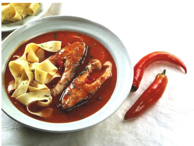
Slika 11. Fiš paprikas, izvor: https://www.podravka.hr/recept/372973/riblji-paprikas/

Unatoč dugogodišnjoj tradiciji proizvodnje vina, ova regija još uvijek nije dovoljno prepoznata kao snažna enološka destinacija među prosječnim hrvatskim potrošačima. Kako bi se promovirala vinska kultura u Baranji, važno je usko povezati baranjsku gastronomiju s lokalnom vinskom ponudom. Vinska karta trebala bi biti sastavni dio svakog jelovnika, naglašavajući da su baranjska vina idealan dodatak raznovrsnoj gastronomskoj ponudi. Dostupnost baranjskih vina u restoranima trebala bi biti naglašena kako bi se izgradio njihov gastronomski imidž. Uz to, korištenje slikovitih motiva poput surduka i gatora te isticanje specifičnosti baranjskog reljefa mogu doprinijeti stvaranju jedinstvene vinske arhitekture i privući turiste. Ova posebnost može postati atrakcija i prepoznatljivi brend Baranje u kontekstu vinske ponude.