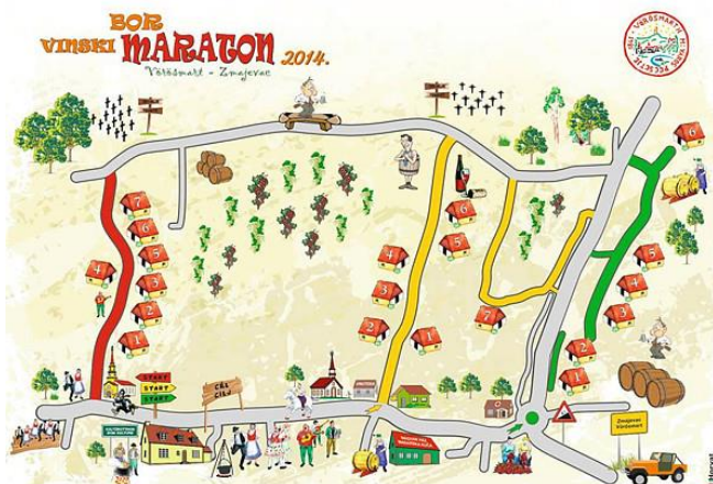
Slika 6. Ruta vinskog maratona u Zmajevcu

HeadOnEast je osječki festival koji objedinjuje kulturu, enogastronomiju i glazbu. HeadOnEast poziva posjetitelje da krenu prema istoku Hrvatske i istraže Slavoniju i Baranju. Trodnevna manifestacija pruža hedonistički užitak istoka u punom sjaju povezujući glazbene nastupe, umjetničke izložbe, sajmove antikviteta, radionice i štandove s hranom i vinom na mnogo lokacija unutar centra grada i starog grada. U tim danima Osijek posebno oduševljava posjetitelje raznolikim prolazima i ulicama s posebnim tematskim sadržajem i kreativnim aktivnostima dok se u zraku širi miris najfinijih regionalnih delicija. Cilj je predstaviti bogatu kulturnu i gastronomsku ponudu Slavonije i Baranje.