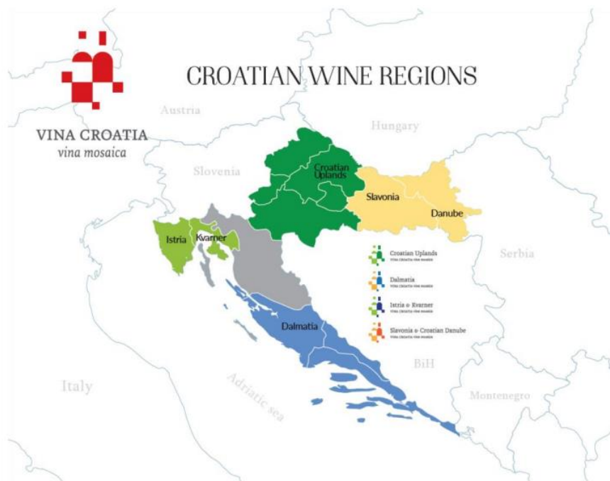
Slika 1. Vinske regije Hrvatske

Vinogradarska regija Slavonija i hrvatsko Podunavlje dijeli se na podregije: