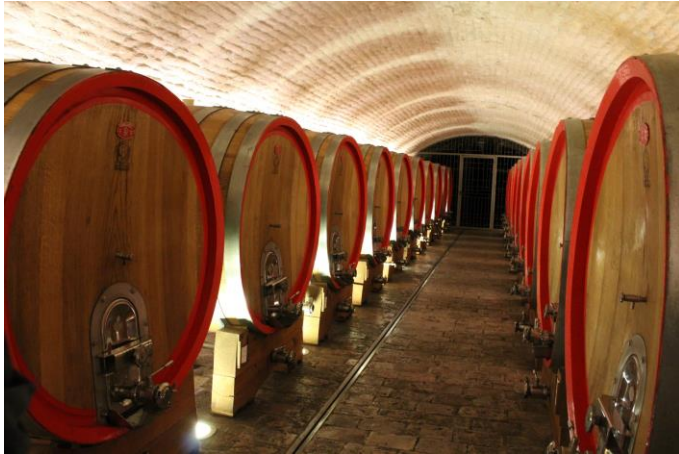
Slika 3. Vinski podrum Belje

Vinotočje Gerštmajer je obiteljsko gospodarstvo koje se bavi agroturizmom i proizvodnjom vina. Obitelj ima tradiciju vinogradarstva koja se proteže kroz već četiri generacije. Vinogradi se nalaze za pogodnom položaju gdje je prisutna stoljetna tradicija vinogradarstva i vinarstva još od doba Rimljana. Vinarija koristi tradicionalne tehnike i moderne tehnologije u proizvodnji vina kako bi stvorila vrhunska vina visoke kvalitete.