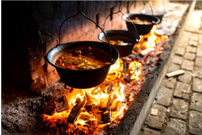
Slika 10. Kuhanje fiš paprikaša u kotliću