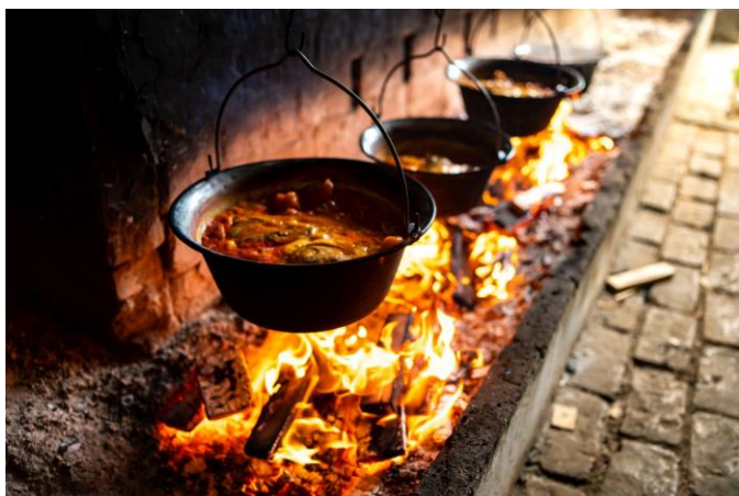
Slika 10. Kuhanje fiš paprikaša u kotliću