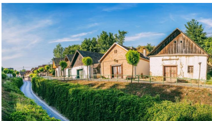
Slika 5. Vinska cesta u Zmajevcu

Od davnina kada su rimske legije prvi put zasijale vinograde u baranjskom području prema željama svojih careva, baranjsko vinogorje stvara bogata i jedinstvena vina posebnih osobina. Tijekom stoljeća znanja su njegovana i pažljivo čuvana i usavršavana te se danas djelić njih može dobiti istraživanjem vinskih cesta. Četiri su vinske ceste na području Baranje, a to su Kneževi Vinogradi, Suza, Zmajevac i Beli Manastir. Svaka od vinskih cesta omogućuje posjetiteljima da osim upoznavanja prirodnih ljepota vinograda, uživaju u vrhunskim vinima i domaćim specijalitetima te otkriju proces proizvodnje kroz razgovor sa stručnjacima. Posjet ovim vinskim cestama pruža jedinstvenu priliku uranjanja u svijet baranjskog vinarstva, ljudi koji ga njeguju te doživljavanja posebnosti vinskog područja.