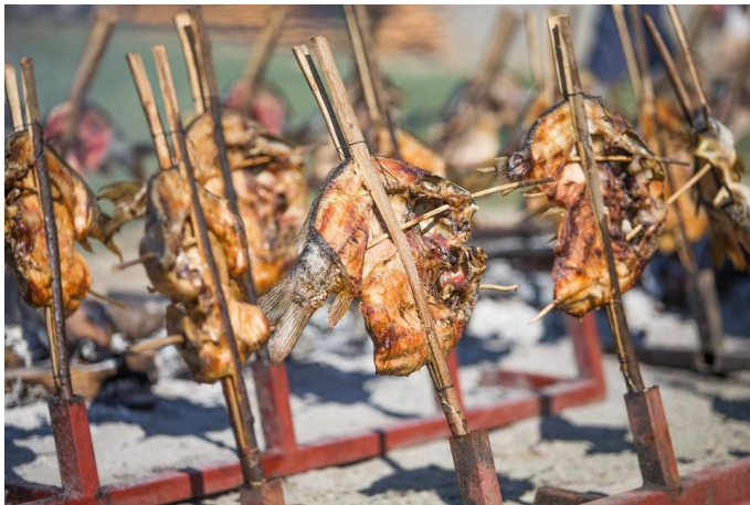
Slika 8. Šaran na rašljama

Dani ribe u Kopačevu su tradicionalna manifestacija posvećena ribarstvu koja se održava u Kopačkom ritu. Ova manifestacija obuhvaća niz događaja i aktivnosti koje slave ribarstvo i bogatstvo prirode tog područja. Posjetitelji imaju priliku sudjelovati u raznim ribarskim aktivnostima poput pecanja, vožnje čamcem ili tradicionalnog ribarenja mrežama. Osim toga, organiziraju se edukativne radionice o ribarstvu i očuvanju prirode, prezentacije tradicionalnih ribarskih tehnika te degustacija ribljih specijaliteta pripremljenih na tradicionalan način. Ribarski dani nude i zabavne sadržaje poput koncerata, folklornih nastupa, izložbi ribarske opreme i tradicionalnih obrta te raznih drugih aktivnosti za posjetitelje svih dobnih skupina. Ova manifestacija privlači ljubitelje prirode, ribolova i tradicije te pruža priliku da se upoznaju s bogatstvom ribljeg svijeta i prirodnim ljepotama Kopačkog rita.