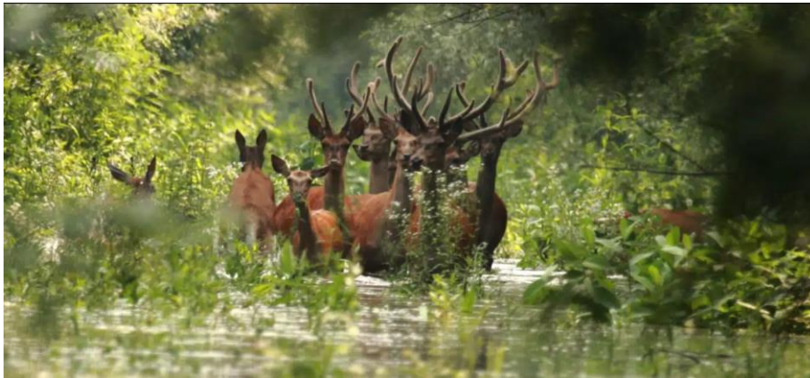
Slika 4. Park prirode Kopački rit

ističe ptičji svijet. Kopački rit dom je gotovo 300 različitih vrsta ptica, uključujući razne rijetke i ugrožene vrste poput crnih roda i orlova štekavaca koji su najznačajniji simbol rezervata.