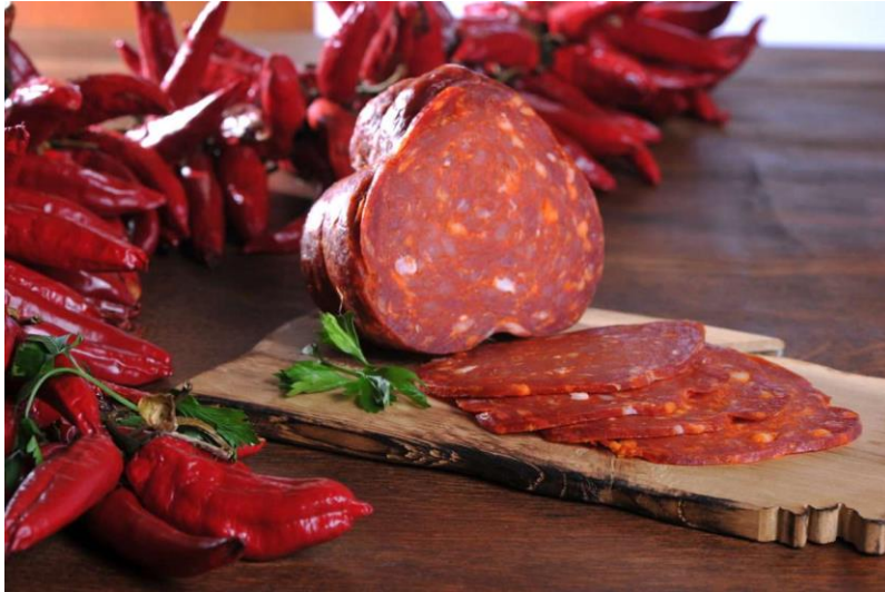
Slika 9. Baranjski kulen, izvor: https://www.belje.hr/product/baranjski-kulen/

na razini Europske unije upisom u registar zaštićenih oznaka izvornosti i zaštićenih oznaka zemljopisnog podrijetla. Zahtjev za zaštitu naziva podnijela je Udruga proizvođača kulena – Baranjski kulen.