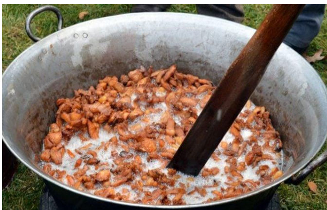
Slika 7. Topljenje čvaraka, izvor: https://www.croatiaweek.com/record-demand-prices-for-cvarci/

Čvarak fest u Karancu još je jedna vesela baranjska manifestacija posvećena „baranjskim tartufima“. U sklopu Zimskog vašara ovaj tradicionalni gastro doživljaj privlači sve veći broj posjetitelja svake godine. Posjetitelji imaju priliku napuniti svoje police poznatim baranjskim suhomesnatim proizvodima, vinima, rakijama, sokovima, sirevima, kolačima, medom, mljevenom crvenom paprikom te prisustvovati natjecanju u topljenju čvaraka.