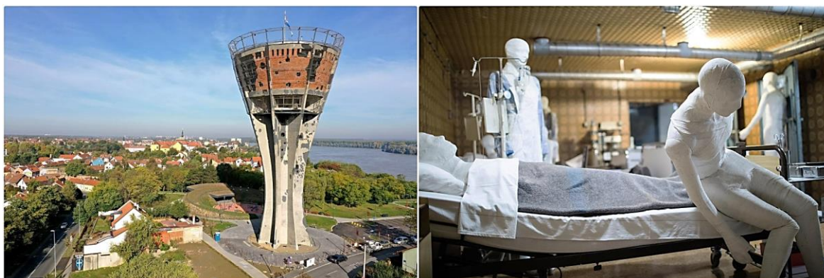
Slika 1. Vukovar - lijevo: Vukovarski vodotoranj; desno: Mjesto sjećanja - Vukovarska bolnica: podrum (Perić 2020; Elvedji 2021)