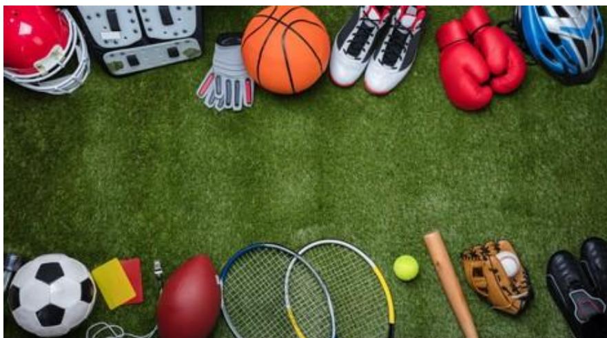
Slika 1. Prikaz rekvizita koji se koriste u sportu