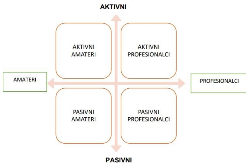
Slika 1. Prikaz pozicioniranja sportskih turista