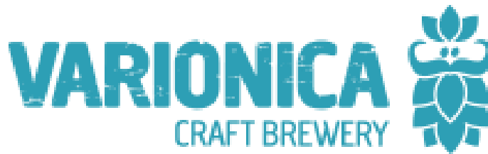
Slika 6. Logo craft pivovare Varionica

Varionica je craft pivovara osnovana 2014. godine u samim počecima craft pivske scene u Hrvatskoj. Ova pivovara je višestruko nagrađivana ne samo u Hrvatskoj već i u svijetu, a svoja postignuća prepisuju inovativnosti, kreativnosti i kvaliteti pri odabiru sirovina i pri proizvodnji craft piva. U stalnoj ponudi nude četiri vrste piva tipa Pale Ale , Neon Stout , Siesta Session IPA i Deep Dive IPA . Osim piva u stalnoj ponudi, Varionica je na tržište pustila i dvadesetak specijalnih piva i piva u kolaboraciji sa ostalim proizvođačima (Varionica Craft Brewery n.d., O nama ). Na Slici 6 je vidljiv logo craft pivovare Varionica.