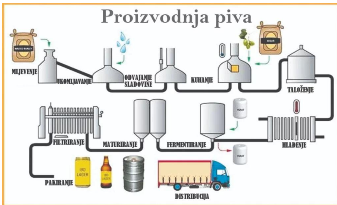
Slika 2. Proces proizvodnje piva