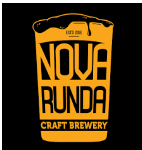
Slika 5. Logo craft pivovare Nova Runda

Nova Runda je craft pivovara koja je osnovana u lipnju 2013. godine i nakon točno godinu dana je na tržište plasirala prvo hrvatsko craft pivo pod nazivom Nova Runda APA. Nakon dvije godine poslovanja i proizvodnje piva, craft pivovara Nova Runda organizira prvi BeerYard festival čiji cilj je bio spajanje glazbene, pivske i street food scene i promocija samo malih nezavisnih ( craft ) pivovara (Craft pivovara Nova Runda n.d., O nama ). Jedan od glavnih razloga za pokretanje BeerYard festivala je promicanje craft pivarske scene u Hrvatskoj te se u sklopu festivala održavaju brojni edukacijski paneli vezani uz craft pivo (Craft pivovara Nova Runda n.d., Zašto organizirate BeerYard festival? ). Nova Runda u 2023. godini na tržištu ima devet vrsta piva tipa India Pale Ale , American Pale Ale , Brown Ale i drugo. Na Slici 5 je vidljiv logo craft pivovare Nova Runda.