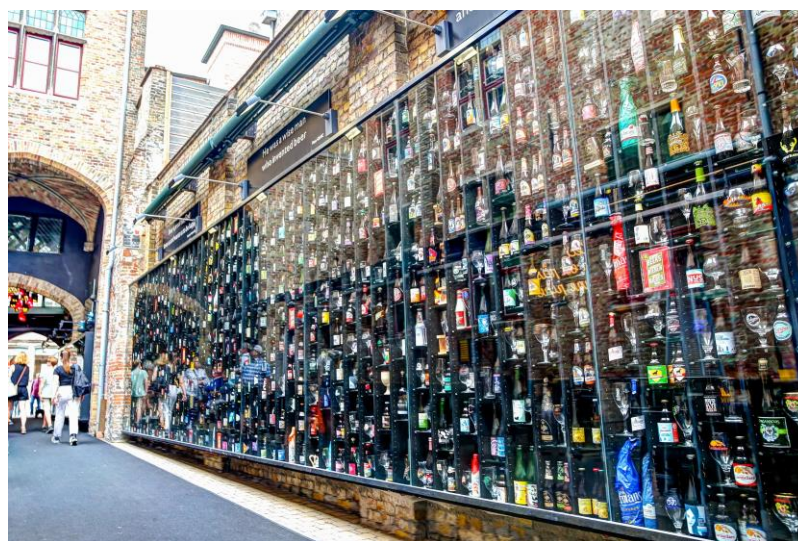
Slika 7. The Bruges Beer Experience muzej

Belgija je poznata kao zemlja čokolade, gastronomije i piva, te zbog toga nije iznenađujuće da ima izrazito razvijen pivski turizam. U Belgiji postoji više od 400 aktivnih pivovara, a neke od njih su svoja vratila otvorile turistima. Također, postoji mnogo muzeja piva od kojih svaki nudi drugačiji aspekt belgijske pivske kulture i svaki ima specifičan pristup. Neki muzeji se više fokusiraju na same sastojke ili proizvodnju piva, dok drugi žele posjetiteljima približiti samu povijest ili transport piva. Jednim od popularnijih muzeja se smatraju The Bruges Beer Experience , koji posjetiteljima nudi zanimljiv i interaktivan način učenja o pivu i pruža mogućnost kušanja piva (Slika 7), te Muzej belgijskih pivara, koji posjetiteljima pruža priliku da nešto više nauče o procesima proizvodnje piva, opremi i samim pivarima ( Beertourism n.d., About Beer ).