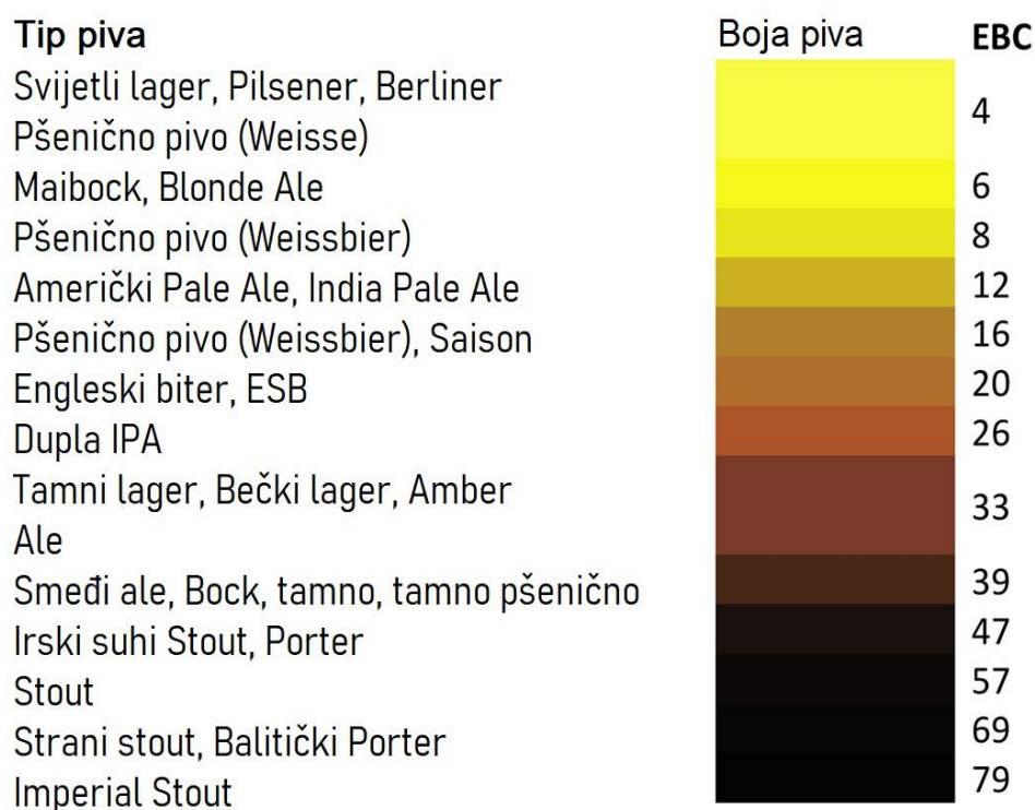
Slika 1. Podjela piva prema EBC ljestvici boja

Na Slici 1 vidljiva je podjela piva prema EBC ljestvici boja u petnaest kategorija. Prema ovome prikazu EBC ljestvica ima raspon od 4 EBC jedinice do 79 EBC jedinica te je vidljiva razlika između nijansi boja piva ovisno o broju jedinica kojim je tip piva opisan. U nastavku rada fokus će usmjeriti na pojašnjavanje podjele piva prema volumnom udjelu alkohola.