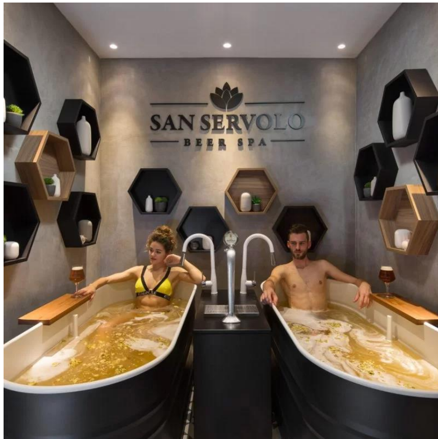
Slika 8. San Servolo Beer Spa

Bujska pivovara je mala istarska craft pivovara koja je 2017. godine otvorila San Servolo Resort & Beer Spa koji je prvi pivski spa u Hrvatskoj. U ponudi wellnessa osim jedinstvene pivske kupke (Slika 8) imaju i masaže, kozmetičke tretmane, saune, fitness i slično (San Servolo Wellness Camping & Resort n.d., Wellness & Spa ).