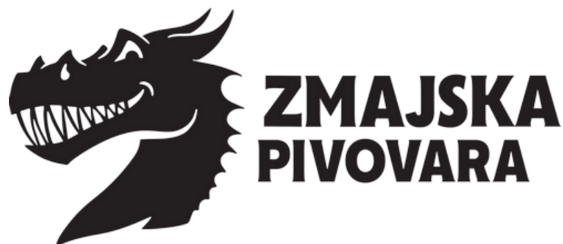
Slika 4. Logo craft pivovare Zmajaska pivovara