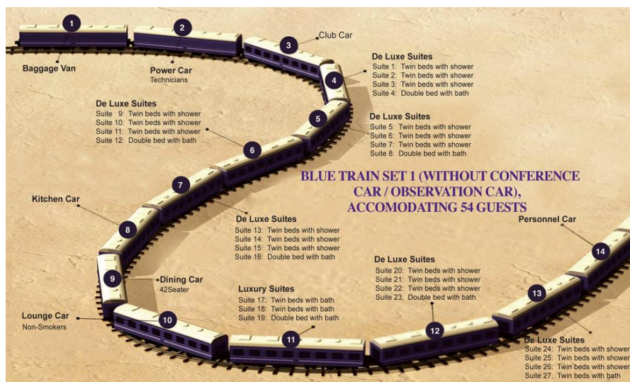
Slika 2. Raspored vagona za kapacitet od 54 gosta