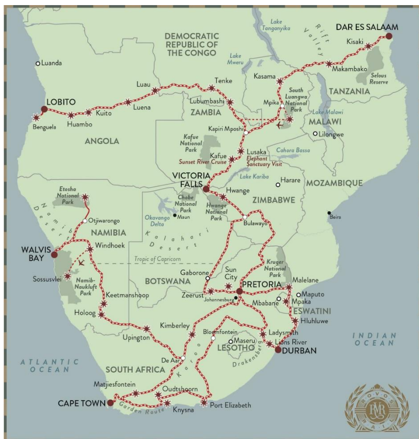
Slika 2. Mapa putovanja Rovos Rail-a