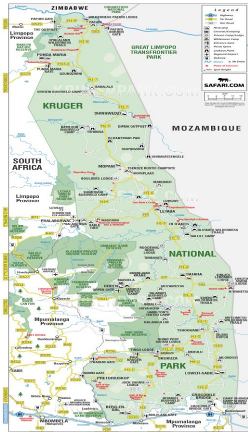
Slika 5. Mapa nacionalnog parka Kruger

Nacionalni park Kruger širok je 60 kilometara i dug 350 kilometara te svojom površinom zauzima 19 455 km 2 . 25 Na slici 6 može se vidjeti smještaj nacionalnog parka koji na istočnoj strani graniči sa Mozambikom, na sjeveru sa Zimbabveom, a ostatak teritorija nalazi se na području Južne Afrike.