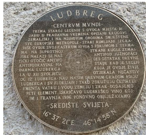
Slika 19 Ploča „Ludbreg-Centrum Mundi“

Družeci se s Ludbrežanima te posjećujući njihove vinograde, zaključio je da se nalazi u samom središtu svijeta. Odlučio je to provjeriti i potvrditi. Uzeo je šestar i na zemljovidu počeo upisivati kružnice sa Ludbregom kao središnjom točkom. Na obodima kružnica pojavili su se svi najveći europski i svjetski gradovi čime je potvrdio svoju teoriju o Ludbregu kao središtu