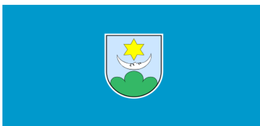
Slika 1 Grb i zastava grada Ludbrega

Dan Grada obilježava se 19. ožujka kao spomen na Bulu Pape Leona X. iz 1513. godine kojom je Ludbreg proglašen prošteništem. 46