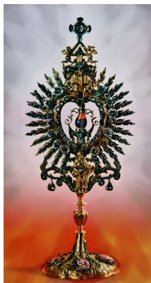
Slika 8 Pokaznica s relikvijom