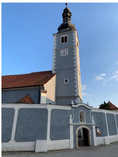
Slika 7 Crkva sv. Trojstva

Crkva sv. Trojstva sjedište je Župe Presvetog Trojstva. U 15. st. je sagrađena kao gotička bazilika, obnovljena je u 17. st., a svoj današnji izgled sa baroknim obilježjima dobila je u 18. stoljeću. 1779. godine je oko Crkve izgrađen kasnobarokni hodočasnički cinktor. Ono najvažnije je da se u njoj čuva Pokaznica s relikvijom krvi Kristove koja je također izrađena u baroknom stilu koju je 1721. župnoj crkvi poklonila bečka grofica Eleonora Terezija Strattman Batthyany. 54 Pokaznica predstavlja najvažniji dio ludbreške baštine jer je upravo ona baza na kojoj se temelji poznatost Ludbrega. Na slici 7 prikazan je današnji izgled Crkve, a na slici 8 je prikazana Pokaznica sa relikvijom.