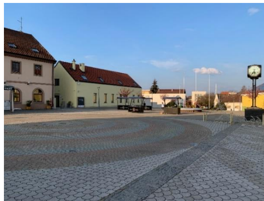
Slika 6 Trg sv. Trojstva – kružnice centra svijeta