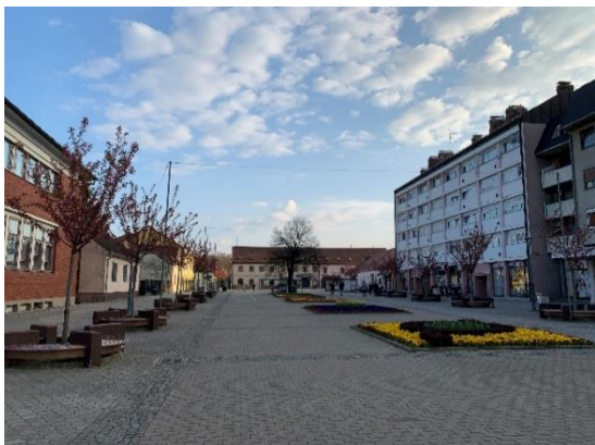
Slika 5 Trg sv. Trojstva

Trg sv. Trojstva je glavni trg Grada na kojem se nalaze koncentrične kružnice koje predstavljaju Centar svijeta. Na kružnicama se nalaze pločice sa imenima gradova prijatelja. Na njemu se nalazi spomenuti Arheološki park, te stambene zgrade, trgovački i ugostiteljski objekti te Crkva sv. Trojstva. Na slikama koje slijede prikazan je trg i kružnice centra svijeta.