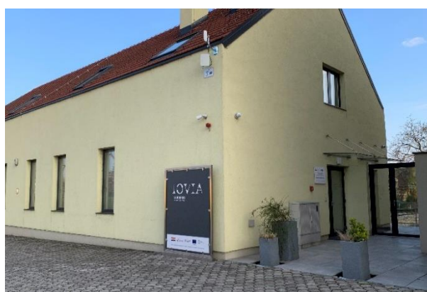
Slika 4 Arheološki park Iovia