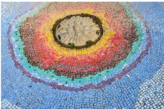
Slika 22 Mozaik centra svijeta

Dr. prof. Erasmus Weddigen došao je u Ludbreg početkom 90-ih godina prošlog stoljeća radi utemeljenja ludbreškog Restauratorskog centra. Nije zaslužan samo za otkrivanje legende o Ludbergi, već i da je Ludbreg centar svijeta. U pitanju je točka od 157 metara nadmorske visine, 46 stupnjeva, 14 minuta i 58 sekundi sjeverne zemljopisne širine i 16 stupnjeva, 37 minuta i 21 sekundu istočne zemljopisne dužine. Ova točka se nalazi kod istočnog ulaza u cinktor ludbreške župne crkve gdje se nalazi i mozaik centra svijeta prikazan na slici 14. Na slici 15 prikazana je spomen ploča koja se nalazi iznad mozaika govori o tome kako su prema legendi s tog mjesta opisani krugovi zemaljski i na njegovim obodima smještene sve svjetske metropole. 67