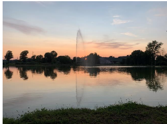
Slika 13 Fontana u jezeru

Od ostalih atrakcija tu je još i Ludbreška vinska cesta na kojoj je vidikovac sv. Vinka koji je zaštitnik Ludbreškog vinogorja, visok 7,4 metra i postavljen na 8 metara visokom postolju s pogledom koji seže do Mađarske, te je najviši kip sv. Vinka na svijetu. Ispred zgrade gradske uprave izložene su i kamene kugle izrazito pravilnog oblika stare 65 milijuna godina. Tu je još most sa ljubavnim lokotima, fontana „Svjetonik svijetu“ koja se trenutno nalazi na geotermalnom izvoru vruće vode koja gori te solarno drvo na trgu sv. Trojsta. Također, tu je i Bakina Hiža i Dedekov Dvor, kućice uređene u stilu 19. i početka 20. stoljeća ispunjene tradicijskom baštinom tog razdoblja od narodne nošnje, namještaja i kućanskih potrepština do dvorišta s oruđem i alatima za obradu zemlje.