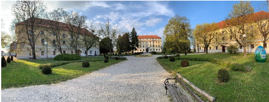
Slika 10 Dvorac Batthyany (sredina), zgrada Gradske uprave (lijevo) i Srednje škole Ludbreg (desno)

Dvorac Batthyany predstavlja kompleks koji se sastoji od trokatnog dvorca u obliku četverokuta, dviju zasebnih zgrada i prostranog perivoja. Najstariji podaci datiraju još iz 1320. godine, za vrijeme turskih pohoda preoblikovan je u renesansni kaštel, a svoj današnji izgled baroknog stila dobio je polovicom 18. stoljeća dolaskom obitelji Batthyany. Početkom devedesetih godina prošlog stoljeća u njemu počinje sa radom Restauratorski centar u sklopu Hrvatskog restauratorskog zavoda. Otvaranje centra potaklo je i restauraciju samog dvorca, a osim radionice u dvorcu se može posjetiti stalni postav Zbirke predmeta sakralne umjetnosti i arhivske građe s područja ludbreške regije te dvorska kapelica Svetog Križa u kojoj se desilo čudo pretvorbe. U zapadnom krilu dvorca Batthyany danas je smještena Gradska uprava te uredi i ispostave državne i županijske uprave, a zgrada desno od dvorca, njegovo istočno krilo prenamijenjena je za prostor Srednje škole Ludbreg. Slika 10 prikazuje dvorac sa perivojem i zgradama uprave i škole.