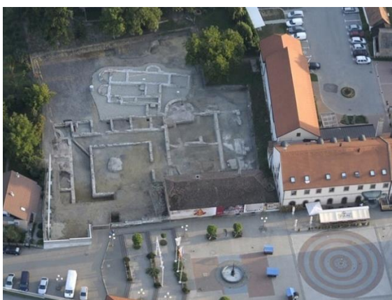
Slika 3 Arheološko nalazište iz zraka

U samom središtu današnjeg Ludbrega nalazi se antičko arheološko nalazište Vrt Somođi, odnosno Rimski Jovija (civitas Iovia – Botivo). Hrvatski restauratorski zavod je proveo sustavna arheološka istraživanja u nekoliko faza u centru Grada te je u cijelosti istražen objekt 1, odnosno Jovijsko kupalište te veći dio objekta 2 koji je organiziran oko pravokutnog nenatkrivenog dvorišta određen sa trijemom sa zapadne strane. 52 Na tom mjestu je 2021. otvoren Arheološki park Iovia u kojem je na suvremeni, multimedijalni način putem AR i 3D interaktivnih modela posjetiteljima omogućen uvid u rimsku kulturu i život na području antičke Iovije. 53 Slikom 3 dan je prikaz arheološkog nalazišta iz zraka gdje se mogu vidjeti spomenuti pronađeni objekti, dok slika 4 prikazuje ulaz u Arheološki park Ioviju.