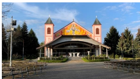
Slika 7 Zavjetna kapela Hrvatskog sabora

Osim Crkve i Pokaznice jedan od najvažnijih sakralnih objekata Grada je zavjetna kapela Hrvatskog sabora, odnosno Svetište predragocjene Krvi Kristove koje svake godine, prve nedjelje u rujnu okuplja hodočasnike na manifestaciju Ludbreške Svete Nedjelje u čast čuda pretvorbe vina u krv Kristovu koje se desilo 1411. godine. Prostor svetišta sastoji se od centralnog objekta Zavjetne kapele, uređenog okoliša sa klupicama i Križnog puta.