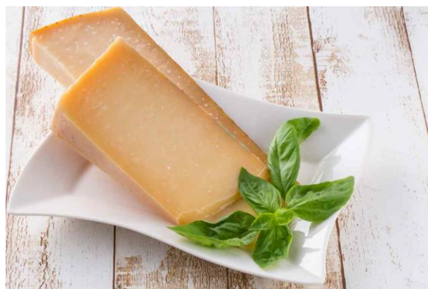
Slika 13 sir Comté

La cinquième étape est le salage, qui se produit immédiatement après le pressage, le fromage est salé pour la saveur et pour créer une croûte. Le salage s'effectue de deux manières, par frottement à sec ou par immersion du fromage dans un bain de sel. Ensuite, le fromage est transféré dans une salle souterraine spéciale à température contrôlée où il mûrira, ce processus dure au moins quatre mois et parfois plus. La dernière étape qui donne au fromage sa spécificité est le calibrage. À la fin de chaque processus, le Comté est évalué et marqué d'une étiquette spéciale qui garantit l'authenticité et qui contient le numéro du fabricant, le lieu de production, le mois et l'année de production.